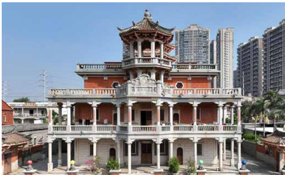
景胜别墅正立面全景图

“泉州：宋元中国的世界海洋商贸中心”22处世界文化遗产点之一的万寿塔（又名：姑嫂塔）是宋元万国海商抵达泉州港的航标，也是现代石狮侨乡最重要的标志。塔下有一座著名侨乡龙穴村，村民都姓高。村内有一座名为景胜别墅的番客楼，系菲律宾华侨高祖景所建。2006年，景胜别墅被评为泉州市“十大魅力古民居”，2019年被国务院核定并公布为第八批全国重点文物保护单位。