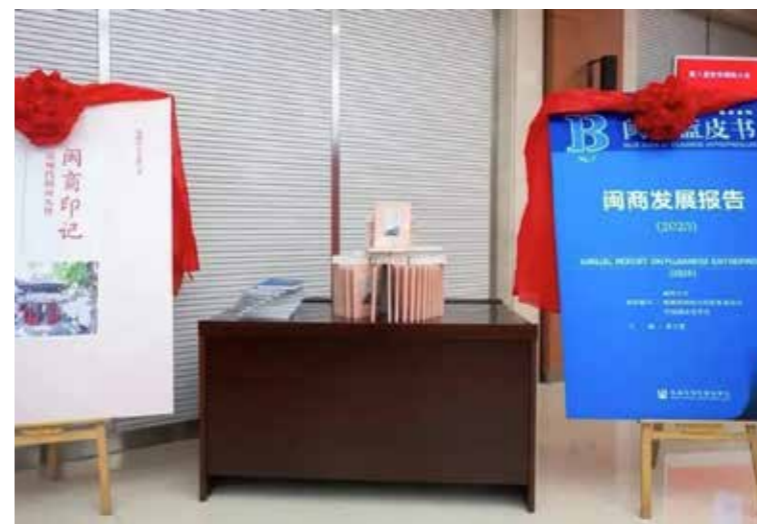
6月14日，《闽商印记——近现代闽商先贤》一书正式发布。