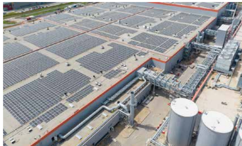
德国图林根基地处图林根州埃尔福特十字工业区，总投资18亿欧元，是宁德时代首个海外工厂。

今日的福建，为闽商提供了前所未有的沃土。福建正全面贯彻实施《民营经济促进法》，深入实施新时代民营经济强省战略，创新发展“晋江经验”，大力推行“四通四到”服务机制，营造市场化、法治化、国际化、便利化的一流营商环境，让民营企业近悦远来、茁壮成长。