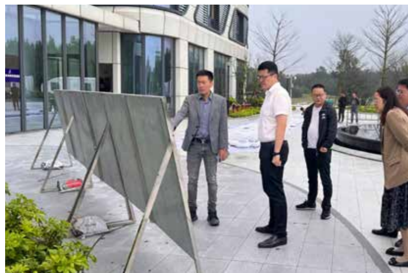
平潭综合实验区侨联在侨企调研，积极推动项目落地。

深化招商引资平台。充分利用实验区投资促进机制，建立侨商投资“一口进出”工作机制，以“进村入企话岚图”活动为抓手，发挥好区侨联联系服务海外侨团、侨商会等来岚投资兴业的桥梁纽带作用。加强与厦门国际银行福州分行、兴业银行等金融机构的合作，深入推进侨商资源与金融资本的有效融合，为侨胞创业提供全方位的金融服务支持。