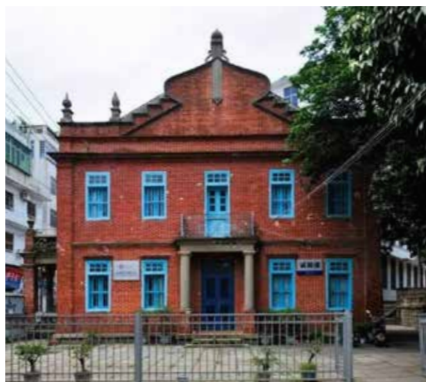
陈嘉庚 1950 年到 1958 年居住的“校董住宅”诚毅楼

作为中国共产党和新中国的领袖，毛泽东连半截香烟都不舍得丢掉。可见，不论是在延安时期，还是新中国成立以后，毛泽东注重节俭、反对浪费、追求物尽其用的生活习惯和作风，始终没有改变。