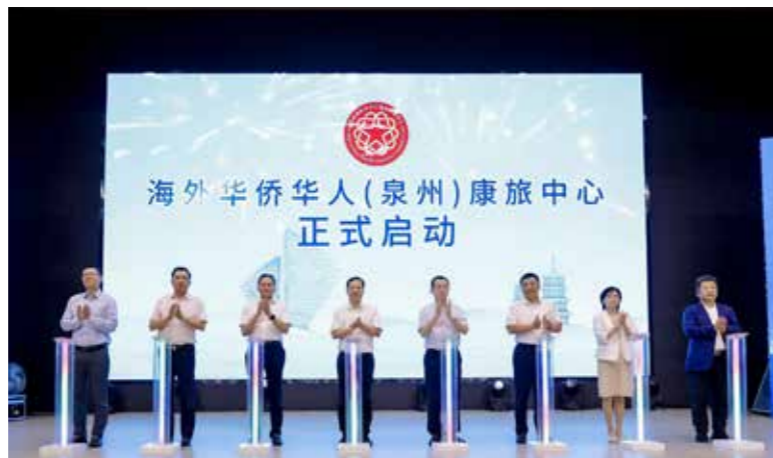
“海外华侨华人（泉州）康旅中心”正式启动

党建引领是核心。党建引领是市侨联“党建领航·侨爱连心”品牌创建成功的关键，只有坚持以党建为引领，坚持以习近平新时代中国特色社会主义思想为指导，坚持贯彻落实习总书记关于侨务工作的重要论述，坚持“根魂梦”主线，才能确保“侨