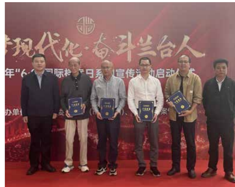
宁德市侨联向市档案馆捐赠涉侨档案资料。

办好“情缘中华·与你寻根”夏令营活动，组织好纪念陈嘉庚诞辰150周年·弘扬“嘉庚精神”活动，支持中国侨乡（福建）研究中心成立宁德联络点，换届宁德市华侨历史学会，开展宁德侨乡文史研究，助力侨乡发展；突出侨联组织的民间性、群众性，进