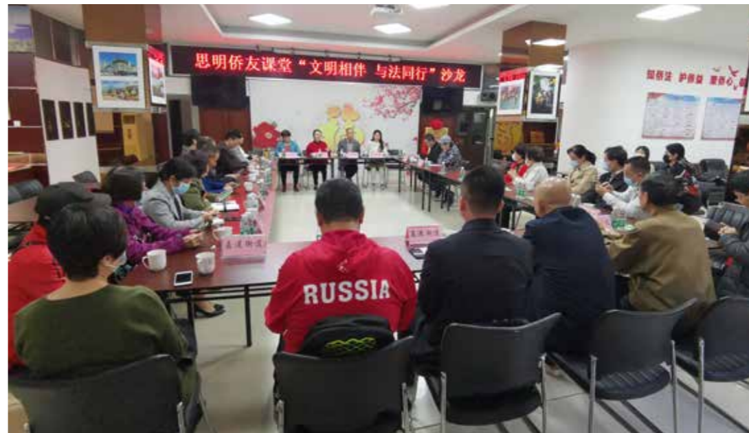
“文明相伴 与法同行”沙龙。

实地探访侨史建筑，以“故事+场景”增强体验感，将课堂延伸至文化现场。思明区侨联不断创新活动形式，除游学、沙龙模式外，还采用讲座、访谈、侨声合唱和“线下开讲+线上直播”等多元方式丰富侨友课堂。同时，邀请侨史研究者、老侨务工作者等组成讲师团队，发挥他们在各行各业的经验和优势，保障课堂内容专业输出。