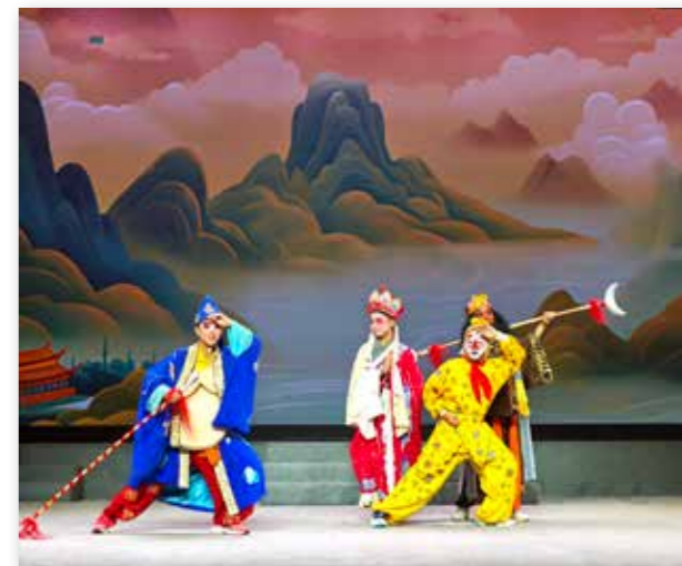
泉州营海外华裔青少年体验高甲戏戏曲文化