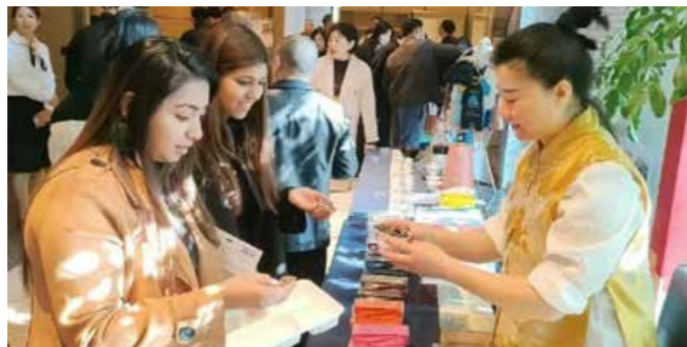
“福品销全球”南平站暨“南平好物卖全球”活动现场

南平的武夷岩茶、茶点、茶器等展品赞不绝口。“希望华侨华人可以把更多中国商品和文化带到南非。”尤文泽表示。