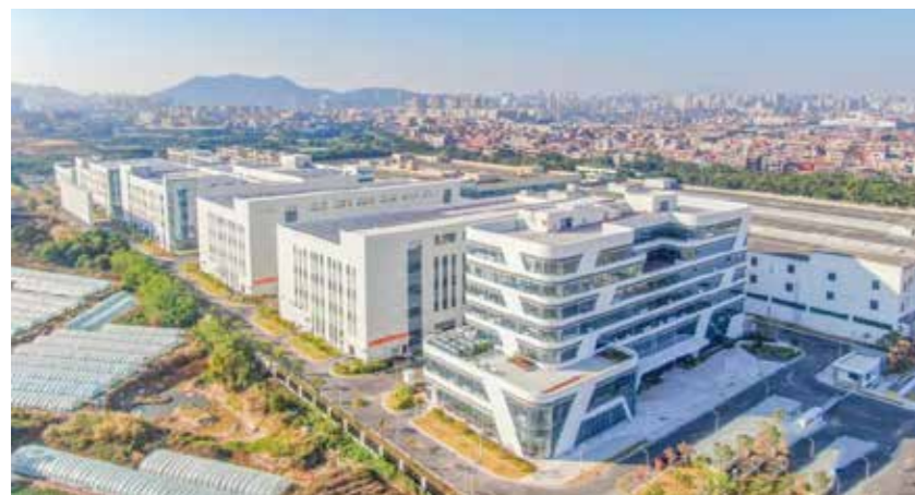
产业之城晋江一隅。