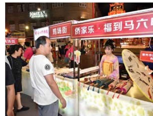
福州非遗油纸伞展示

“侨家乐·福到马六甲”文化集市成为中马民间文化交融的重要平台。在马来西亚马六甲专区，沙嗲、娘惹糕点、榴莲制品等当地美食芳香四溢，蜡染布、锡器、峇迪服饰、传统乐器等手工艺品精巧迷人，引人驻足品鉴参观、流连忘返。在福州非遗与烟台山街区专区，商家们带来了烟台山历史街区主题文创和油纸伞等各式非遗作品，以及茉莉花茶、临水平安饼、福茶等闽都特色产品，现场推出的汉服体验和簪花、三条簪等制作演示，更是吸引了众多当地华人前来体验参观。