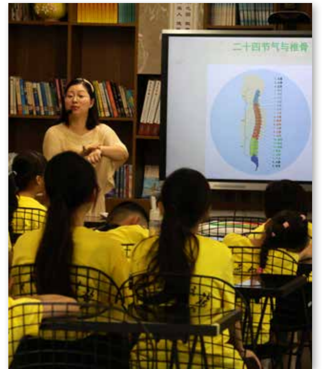
平潭营香港营员们在上中医课