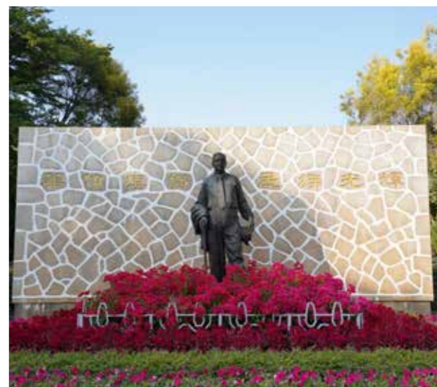
归来园陈嘉庚铜像

为了照顾陈嘉庚，他的第八个儿子陈国怀选择回国到集美工作，1958年陈嘉庚遗嘱交待其生活费应以“家庭人口计算，每人每月25元。今后若有亲