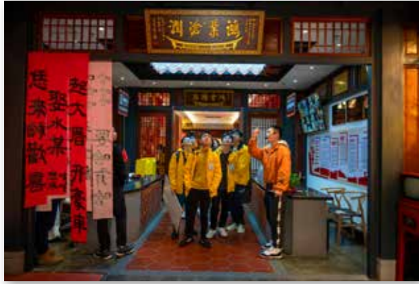
泉州南音营马来西亚华裔青少年在来旺良品堂学习传统婚嫁习俗