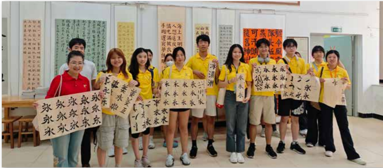
泉州营海外华裔青少年展示书法课作品