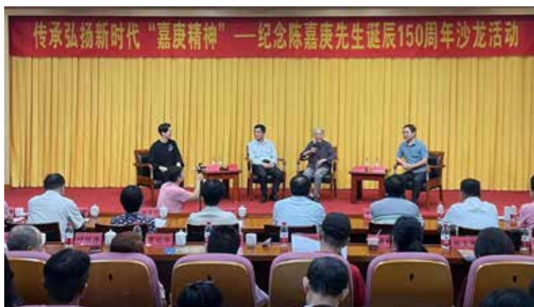
传承弘扬新时代“嘉庚精神”沙龙活动。

年陈嘉庚先生招募回国抗战的南侨机工时，“第一要求”让她印象特别深刻：“必须要爱国。爱国也不是自己讲的，要有人证明你是爱国的，是真诚的，而且不能有不良嗜好。”