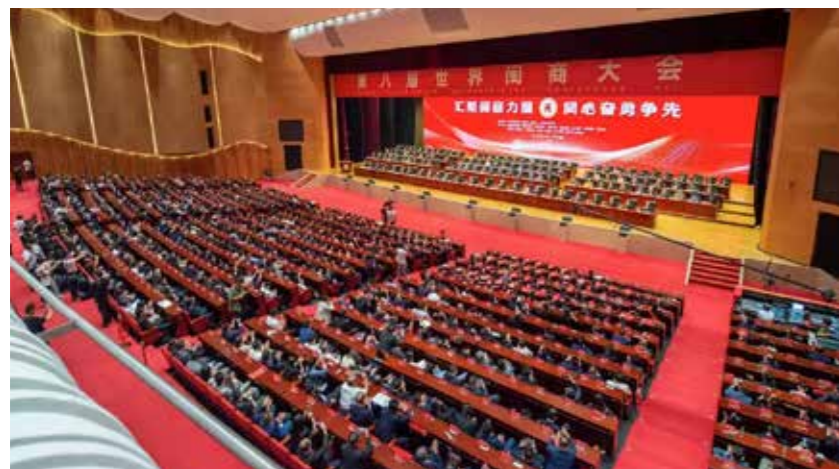
第八届世界闽商大会现场。