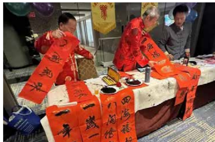
美国福建书画家协会组织现场挥毫

侨胞送上端午节祝福。他表示，福建美食文化丰富多样、博大精深，是中外文明交流互鉴的重要文化载体。三年来，福建省侨联发起举办“侨家乐·福建省华侨美食文化交流活动”30多场，至今已在福建省内以及意大利、西班牙、马来西亚等多个国家和地区成功举办，赢得了广泛赞誉。感谢美国福建工商总会的大力支持，让活动得以成功走进纽约。