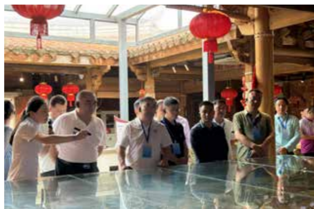
考察团一行走进梧林传统古村落

活动现场，省侨联部署了惠侨资金特别是华侨事务预算专项经费使用管理督导调研的相关工作，对各地开展以“侨胞之家”建设为重点的基层侨联阵地建设情况进行了专题调研，围绕深入贯彻中央八项规定精神学习教育征求了各地意见建议。此外，组织大家在书面汇报交流的基础上，围绕基层建设工作特别是华侨事务预算专项经费使用管理、基层侨联组织赋码登记管理等重点内容展开讨论交流。各设区市参会人员畅所欲言，讨论热烈，分享了各自在实际工作中好的经验做法，并针对基层开展为侨服务中的困难问题和对策进行了深入交流。