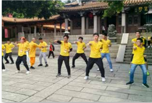
石狮营菲律宾营员在泉州少林寺学习武术