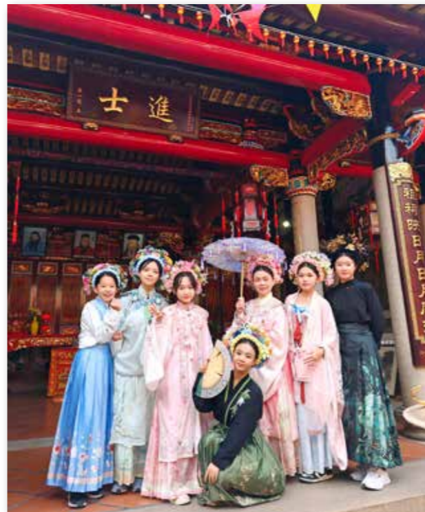
龙岩营马来西亚华裔青少年体验汉服和簪花文化