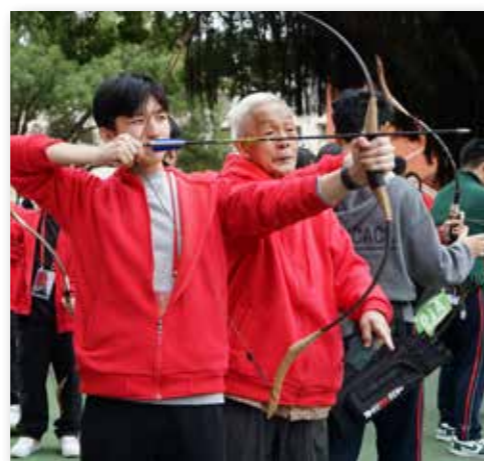
福清营印尼华裔青少年在福清侨中体验射箭