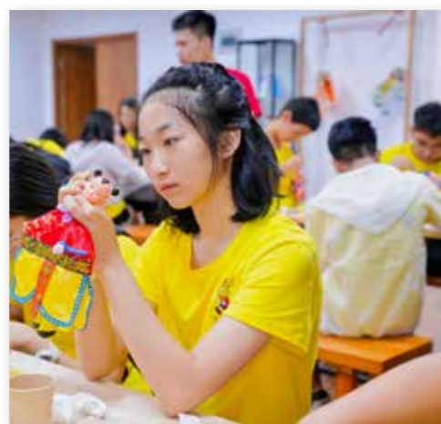
厦门营香港集美校友后裔们制作属于自己的木偶