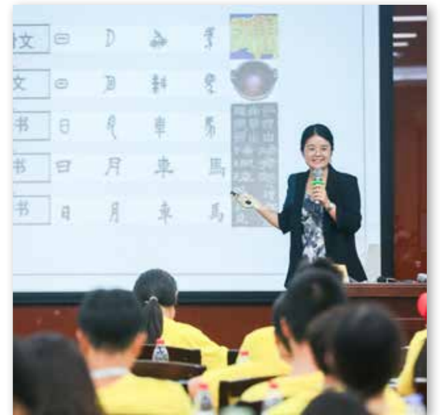
华侨大学营员上汉语课