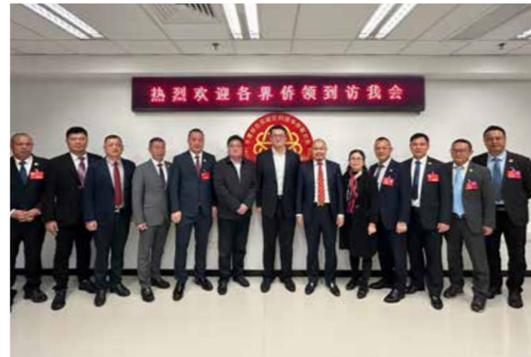
岚籍侨领到访平潭综合实验区侨联

搭建引才引智平台。以“青春时尚 国际风范”为主题主线，围绕实验区加快打造高辨识度的国际旅游岛中心工作，积极搭建侨界人才交流合作、信息共享、资源共用的平台，多维度、多渠道吸引地中海、东南亚等国际海岛旅游目的地的侨胞参与平潭开放开发，推动侨资侨智在岚深度融合发展。