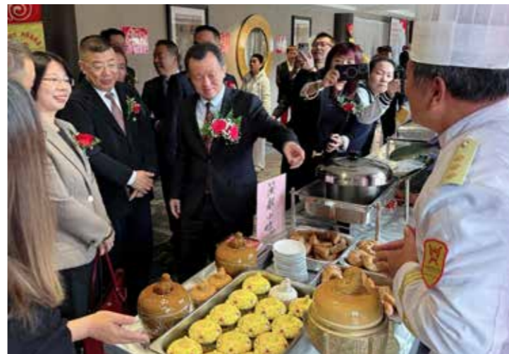
参观闽都小吃展位