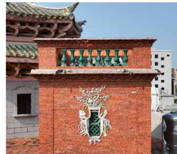
琉璃栏杆、琉璃窗花和瓷雕

二层至四层墙体均为红砖人字砌成，寓意人丁兴旺、红红火火。一层二层同构，三层四层逐层收进。三层平台中央建一座两层单檐八角攒尖顶凉亭。亭内用斗拱组成藻井，亭顶红梁绿瓦，耸天而立，强