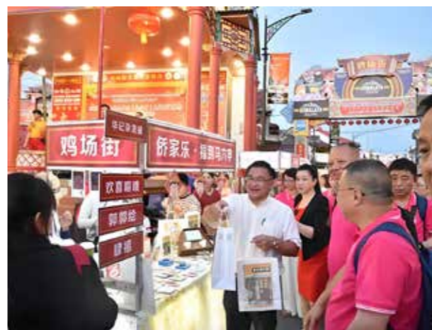
与会嘉宾参观文化集市