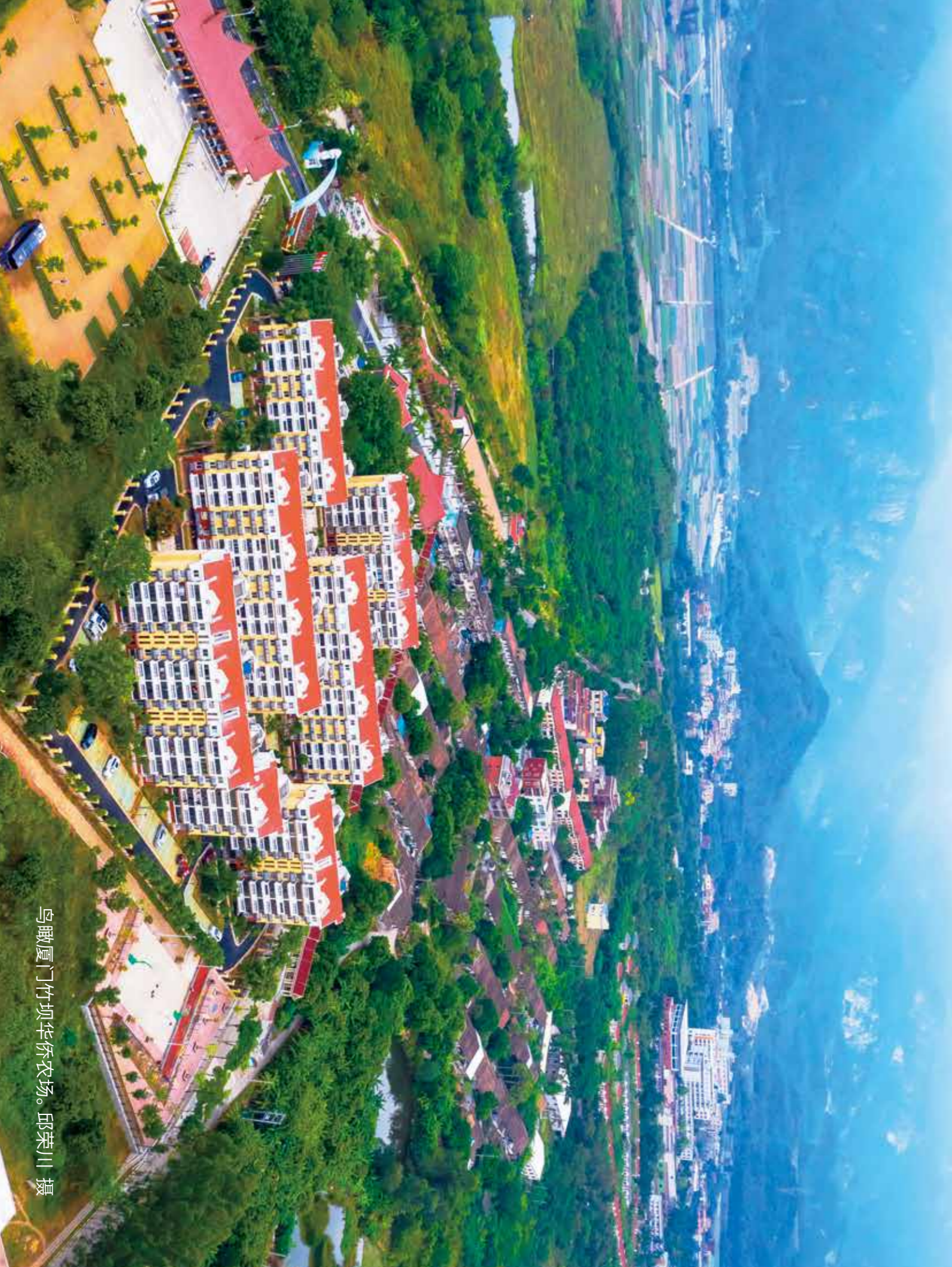
鸟瞰厦门竹坝华侨农场。