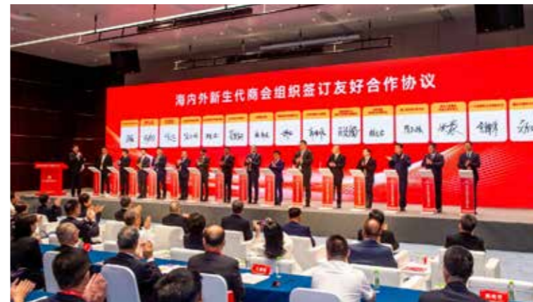
15家海内外新生代商会组织签订《友好合作协议》，携手凝聚新生代闽商力量。

周祖翼说，今天的福建，发展动能持续增强，发展环境日臻完善，发展前景无限广阔。福建将深入学习贯彻习近平总书记在福建考察时的重要讲话精神，奋勇争先推动产业转型升级、深化对外开放合作、培育投资兴业沃土，全方位推动高质量发展，为广大闽商在家乡创新创业创造搭建广阔舞台、拓展空间潜力。希望广大闽商胸怀报国志、一心谋发展、守法善经营、先富促共富，厚植家国情怀，增强发展信心，助力家乡建设，持续造福桑梓，为全省在中国式现代化建设中奋勇争先作出新的更大贡献。周祖翼表示，关注闽商、呵护闽商、服务闽商、