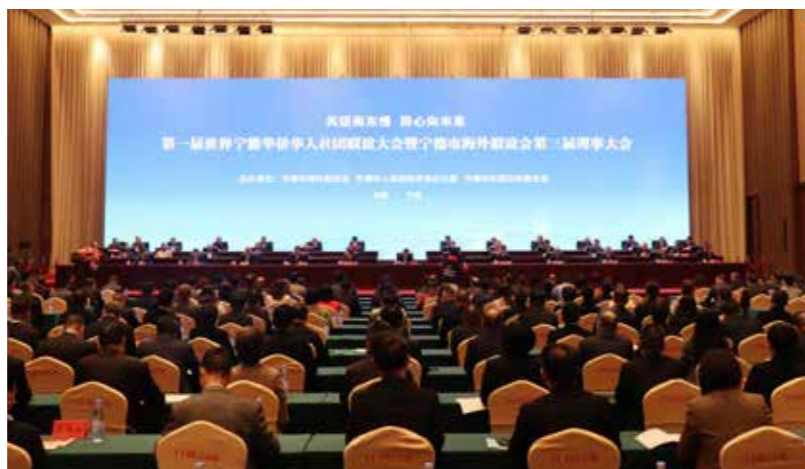
第一届世界宁籍华侨华人社团联谊大会暨宁德市海外联谊会第三届理事大会开幕。

更好地为我市发展服务；用好世界宁籍华侨华人社团联谊大会和宁德市海外联谊会的重要平台，加强与全球宁籍华侨华人联谊交流，凝侨心、汇侨智、聚侨力；借助中央媒体海外机构网络的力量，收集海外留学生等各类人才信息，充实我市海外人才信息库，推动我市主导产业的人才引进，有力服务新一轮高质量发展。