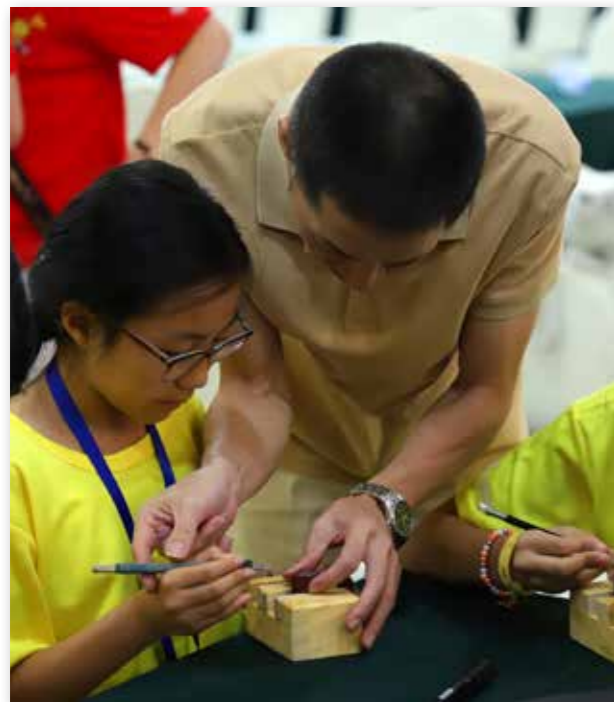
福建高专营海外华裔青少年学习篆刻技艺