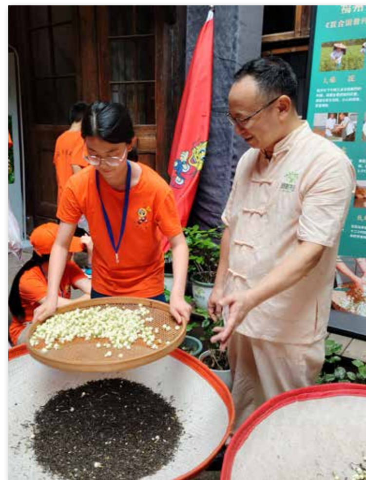
福州营欧洲华裔青少年体验茉莉花茶窰制工艺