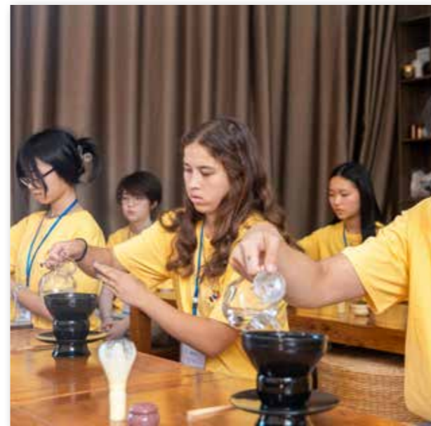
福州外语外贸学院夏令营海外华裔青少年体验点茶文化