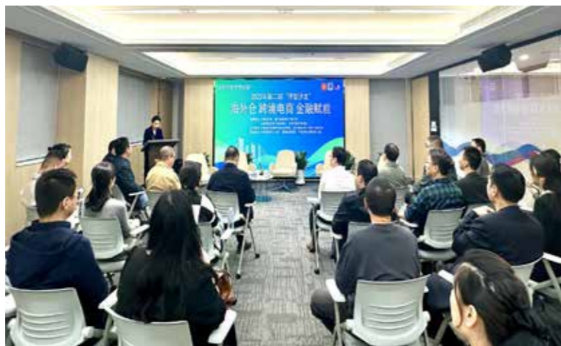
宁德市侨联举办“侨创宁德 梦想东湖”侨智沙龙活动。