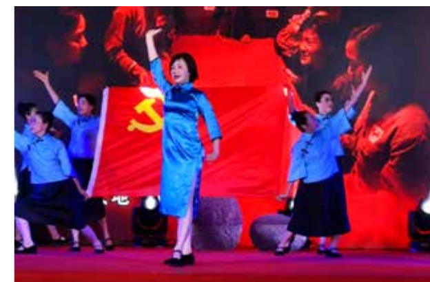
东肖侨联侨声艺术团走进溪连小学开展文艺宣传活动。图为音乐情景剧《红梅赞》。

东肖侨联侨声艺术团队员们大多非专业出生，且多为中老年朋友，平日从事生产劳动，业余时间就练习民族民间歌舞，既陶冶个人的艺术情操、丰富群众精神文化生活，也为民族民间文化传承尽一份力量。他们扎根基层生活，在创作表演中传承和弘扬了弥足珍贵的民族文化艺术，也让基层群众的生活更加绚烂多彩。艺术团认真贯彻落实《中华人民共和国归侨侨眷权益保护法》《福建省华侨权益保护条例》，坚持以侨为本、为侨服务的宗旨，加强涉侨法律法规宣传。急侨胞之所急，解侨胞之所需，多次组织开展“情暖困难群体—春节慰问活动”“福侨爱心包”发放仪式等关爱归侨侨眷活动，还利用中秋、重阳等重要节日，开展重点归侨困难户走访慰问演出活动，帮助他们解决生产生活困难。通过表演富有本土特色的文艺节目，如音乐情景剧《红梅赞》《绣红旗》、音乐小品《过河》、山歌说唱表演《传播革命火种的海归楷模—邓子恢》等节目，形象演绎了一段段生动感人的红色故事，尤其是国家级非物质文化遗产代表性项目“龙岩采茶灯”，让大家体验感受传统文艺的魅力，凝聚团结奋斗的力量。多年来，利用“民间窗口”优势探索多种形式为海外侨胞服务，了解当地侨胞的需求和重点关心的问题，并根据需求不断调整、巩固、发展、提高，真正起到桥梁和纽带的作用。