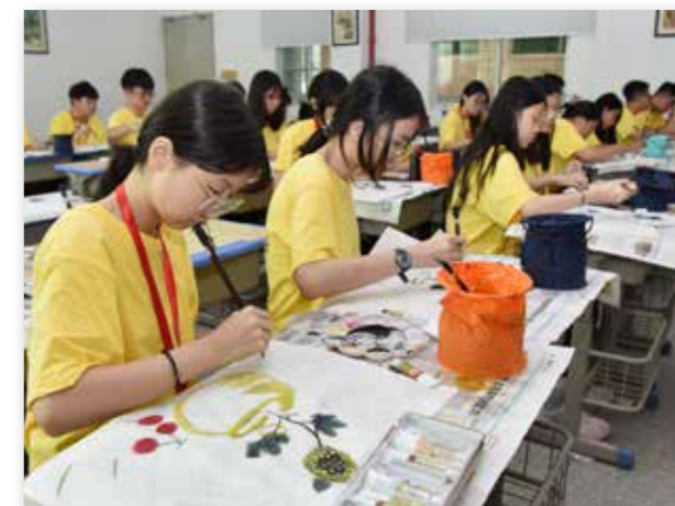
南安营印尼华裔青少年们学习国画