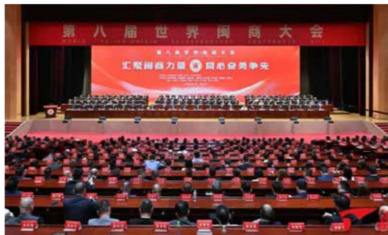
6月18日，第八届世界闽商大会在福州举办。

牢记嘱托，敢为人先、爱拼会赢，善观时变、富民兴邦，共同书写了搏击商海的奋斗传奇、推动了福建经济的繁荣发展、担当了对外开放的开路先锋、汇聚了促进共富的重要力量，成为福建引以为傲的“金色名片”。