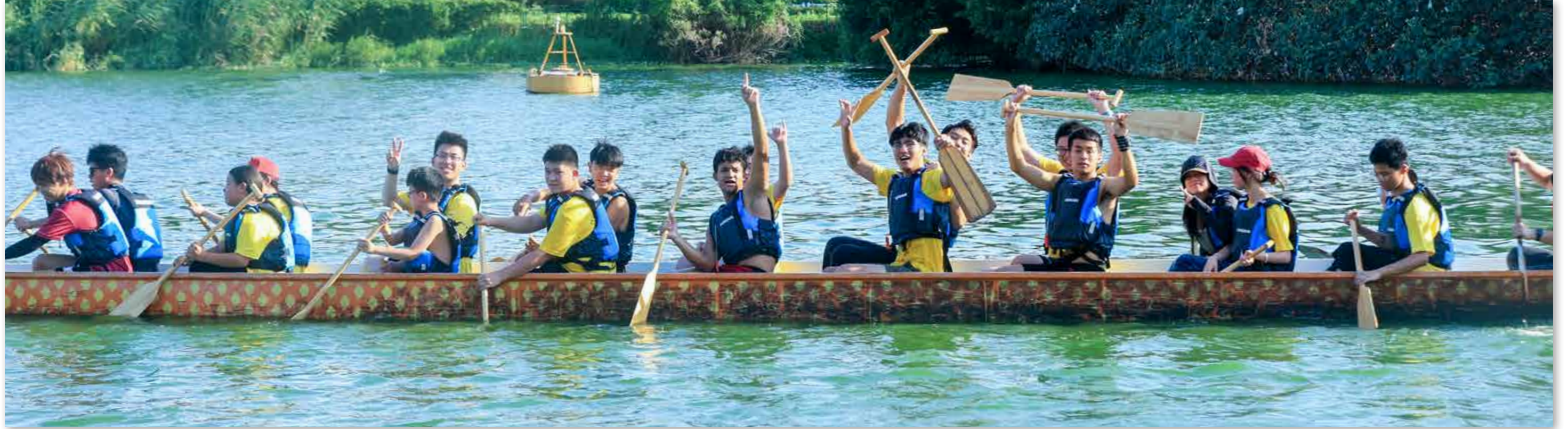
华侨大学营员体验划龙舟