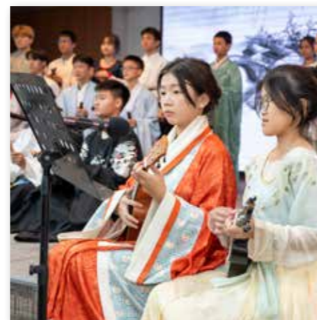
泉州南音营马来西亚华裔青少年在闭幕式上作南音表演