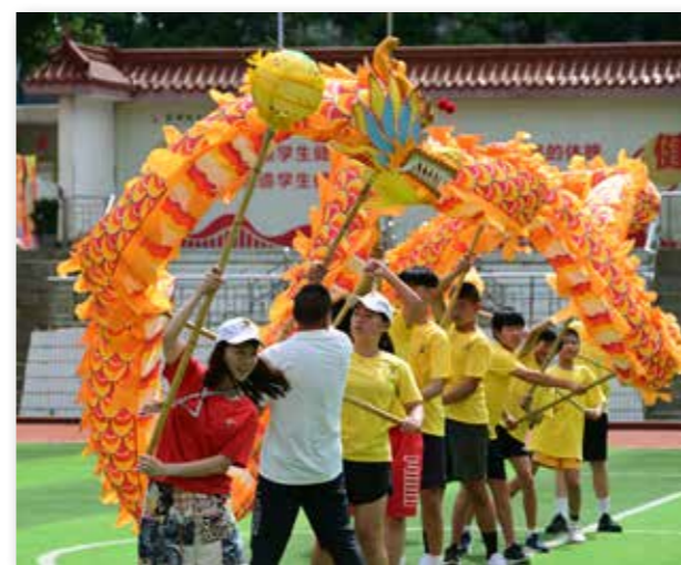
湛江营澳大利亚华裔青少年体验舞龙技艺