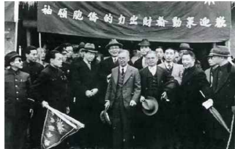
1940年3月,陈嘉庚率“南洋华侨回国慰劳视察团”前往中国15省慰劳抗日军民,专程到滇缅公路视察,看望南侨民工。

根据这个规定,集美学校的学生每个月月末必须将本月用款数目及用途详细列入簿册并报告训育课。为了帮助学生养成节俭的习惯,集美学校在期