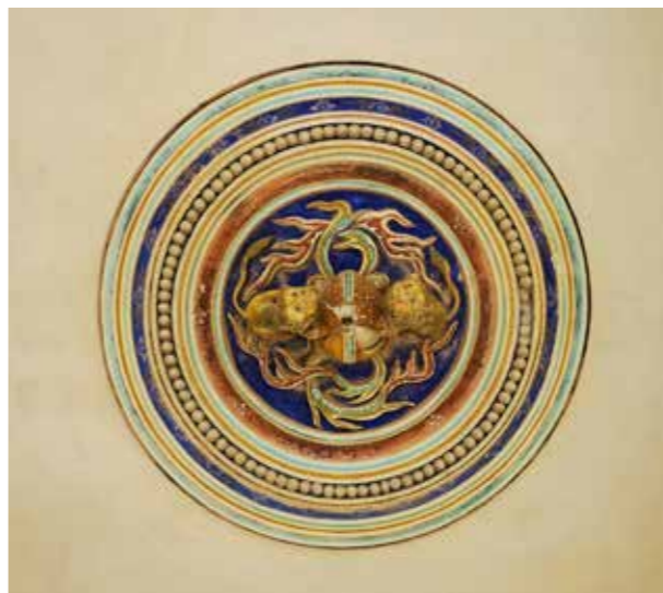
景胜别墅一楼天花板灯圈“双狮戏球”

景胜别墅为砖石承重结构。一层主体以白色花岗石墙承重，二层用红砖，四周廊柱为白石梁柱式外廊，局部用青石，如一层的柱础、门楣、门簪、窗棂。大门门匾镌刻望“曝麦观书”，楼主以此光耀门楣，旁注“己丑蒲夏”，说明别墅落成于1949年5月。