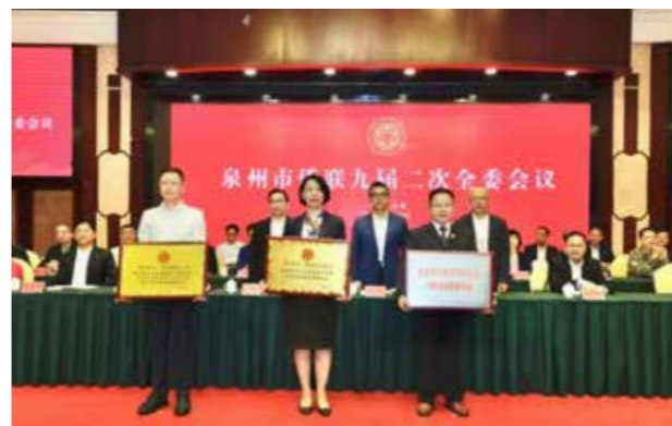
在泉州市侨联九届二次全委会上为“侨+”便侨利侨服务点授牌

困难侨救助服务，努力满足海外侨胞、归侨侨眷健康服务新需求。一是住院优质服务，对于经临床科室诊察后有需要住院治疗的侨胞提供“绿色通道”，在条件允许下，优先安排入院治疗或提供专家会诊。同时经市侨联牵线，可为到院诊治的海外侨亲提供治疗期间诊查结果的涉外翻译服务。二是网上问诊服务，包括组建专业医生团队开通面向海外侨界的网上义诊、心理援助、中医养生保健讲座等云端服务。在条件允许的情况下，由县以上侨联受邀组队赴海外、港澳地区开展义诊活动等。三是困难侨救助服务，每年联合组织一次下基层为侨乡群众提供义诊及免费送药服务。对困难归侨侨眷因重大疾病就诊后，经个人申报，镇村（街居）侨联查验公示，县级侨联核实，符合临时救助条件者，由侨联在当年度给予每人最高不超过1万元的一次性救助。