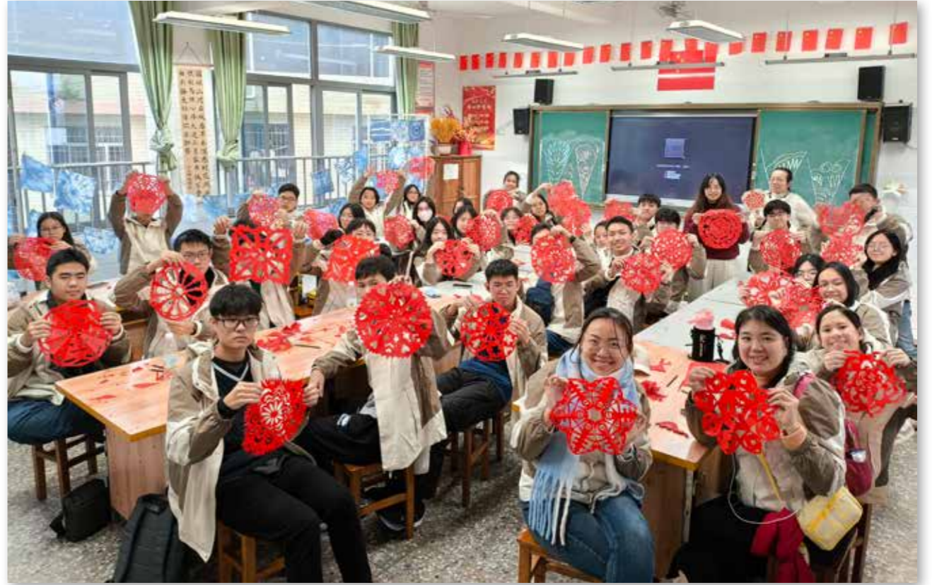
龙岩营马来西亚华裔青少年体验剪纸