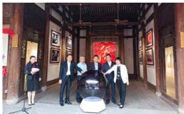
南洋华裔族群寻根谒祖综合服务平台于2021年在福建华侨主题馆正式上线试运行

作出了积极贡献。寻根平台自上线运行以来已经获得200多万的关注量，并帮助马来西亚国际羽坛名将李宗伟，拓展现实（XR）技术领域专家、马来西亚华人庄以仁，旅美华人辜延良等近百位侨胞成功寻根。