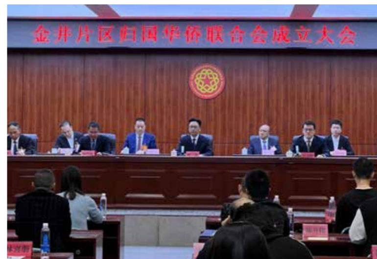
金井片区第一次归侨侨眷代表大会暨金井片区归国华侨联合会成立大会召开

夯实基层基础平台。要坚持大基层工作导向，以实验区侨联换届为契机，建立健全片区村（社区）