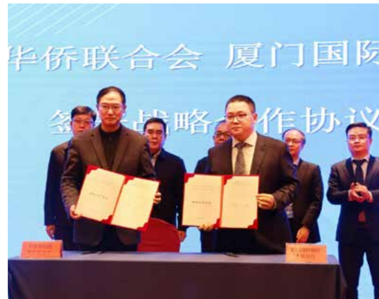
宁德市侨联和厦门国际银行宁德分行签署战略合作协议。

一步发挥好古田临水宫、极乐寺和屏南甘国宝故居等涉侨文化阵地积极作用，加强市涉台部门和台企的联络，搭建“以侨促融 侨台共建”联动平台，推进同台湾岛内侨团的联系，积极参与推动两岸融合发展。