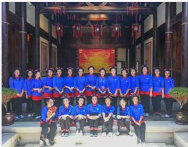
莆田营印尼华裔青少年体验湄洲女传统服饰