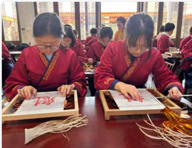
永春营马来西亚华裔青少年体验制作纸画团扇