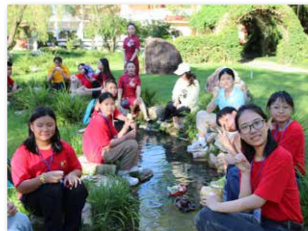
漳州营菲律宾华裔青少年参加曲水流觞茶会

2024年是著名爱国华侨领袖、企业家、教育家、慈善家和社会活动家陈嘉庚先生诞辰150周年。在中国侨联和福建省委、省政府的关心指导下，福建省侨联深入学习贯彻习近平总书记关于侨务工作的重要论述重要批示指示精神，进一步落实习近平总书记给厦门集美校友总会回信精神，弘扬新时代“嘉庚精神”，紧扣“汉语、文化、寻根”主题，传承弘扬中华优秀传统文化，先后举办了36期“中国寻根之旅”夏（冬）令营，并在嘉庚故里厦门集美区集结。来自25个国家和地区的1925名营员来闽参营体验传统文化魅力，开启了一场场奇妙的文化之旅。夏（冬）令营的足迹遍布八闽大地，增进了海外华裔新生代对祖（籍）国的了解，提高他们学习汉语和中华文化的兴趣，参营人数位居全国前列，在海外侨界反响热烈。