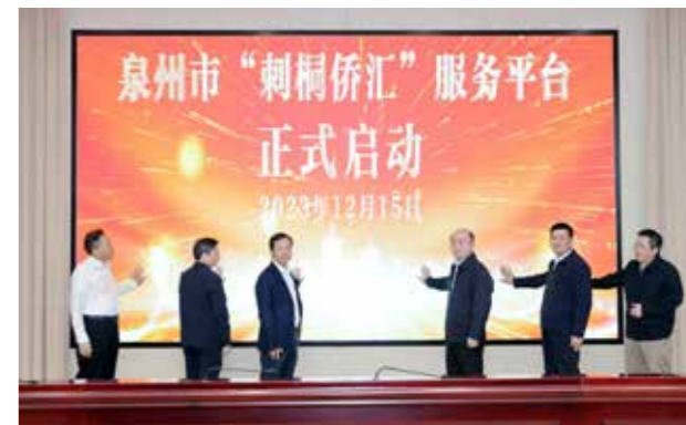
泉州市“刺桐侨汇”服务平台正式启动

一张网”就可办成事，实现海外侨胞结汇“一趟不用跑”。为确保活动落地见效，市侨联成立了部室党员业务攻坚小组，并在侨汇结汇便利化业务开展中，指定2名党员专门负责，24小时随时接领任务，及时核实侨胞提供的申报材料，并根据实际情况提出结汇合理金额建议。