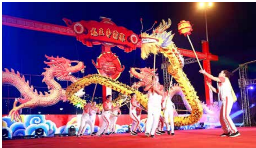
东肖侨联侨声艺术团参加“龙王争霸赛”活动

作为全省唯一的乡镇侨声艺术团——东肖侨联侨声艺术团，是东肖镇乃至新罗区文艺界的一张亮丽名片。艺术团成立之初，由华侨侨胞捐资组建，成为联络海内外的一座桥梁。一方面，坚持大胆“走出去”。艺术团曾先后到香港龙岩同乡会、印尼雅加达龙岩同乡会参加演出，通过歌唱、舞蹈、器乐、山歌等华侨喜闻乐见的表演形式，展示了龙岩特色，让海外侨亲听乡音、解乡愁、增乡情，营造了爱国爱乡的浓厚氛围。另一方面，积极对内宣传。在各级各类文艺汇演表演了精彩纷呈的节目，展现了“东肖风采”。多次前往侨乡、侨资企业、养老院等，开展慰问演出，深受好评。如，2021年参加龙岩市侨联主