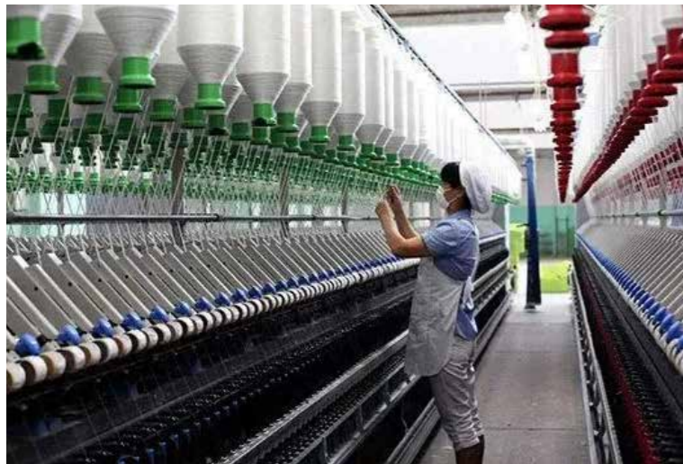
福建金源纺织有限公司是福建省纺纱规模首家突破70万锭的企业，是省内最早一批建造5G智慧工厂的纺织企业。