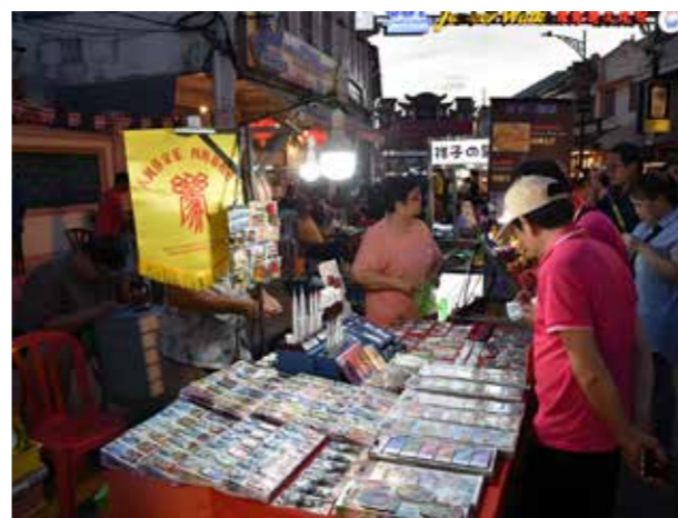
马来西亚手工艺品引人驻足参观