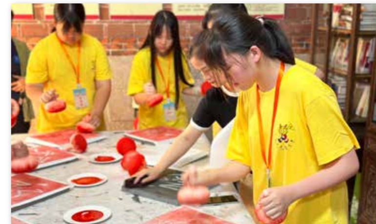
安溪营台湾营员体验汉字拓印技艺