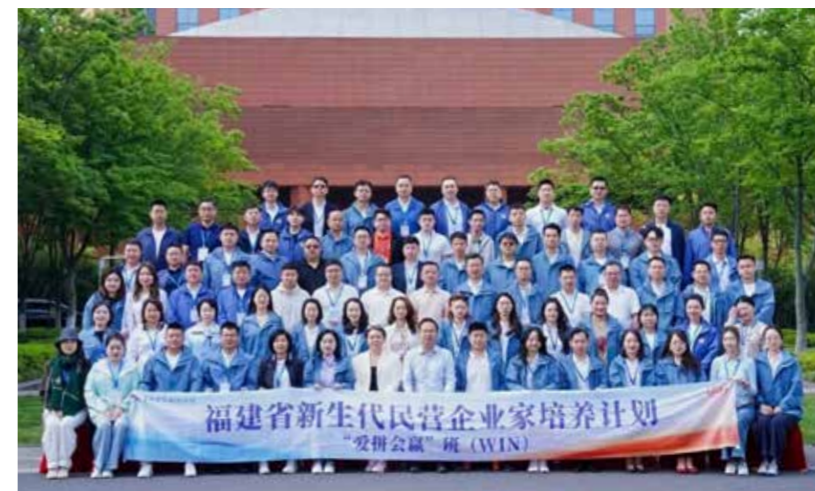
福建省新生代民营企业培养计划“爱拼会赢”班（WIN）学员相聚“数字之城”杭州。