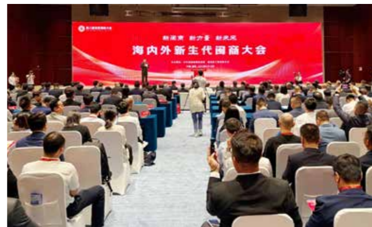
6月18日在福州举办的第八届世界闽商大会期间，海内外新生代闽商大会首次举办。

周祖翼说，今天的福建，发展动能持续增强，发展环境日臻完善，发展前景无限广阔。福建将深入学习贯彻习近平总书记在福建考察时的重要讲话精神，奋勇争先推动产业转型升级、深化对外开放合作、培育投资兴业沃土，全方位推动高质量发展，为广大闽商在家乡创新创业创造搭建广阔舞台、拓展空间潜力。希望广大闽商胸怀报国志、一心谋发展、守法善经营、先富促共富，厚植家国情怀，增强发展信心，助力家乡建设，持续造福桑梓，为全省在中国式现代化建设中奋勇争先作出新的更大贡献。周祖翼表示，关注闽商、呵护闽商、服务闽商、