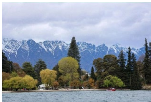
新西兰风光

这些组织紧密联系福建各地市及各大高校的乡亲和校友，秉承着“爱国爱乡、海纳百川、乐善好施、