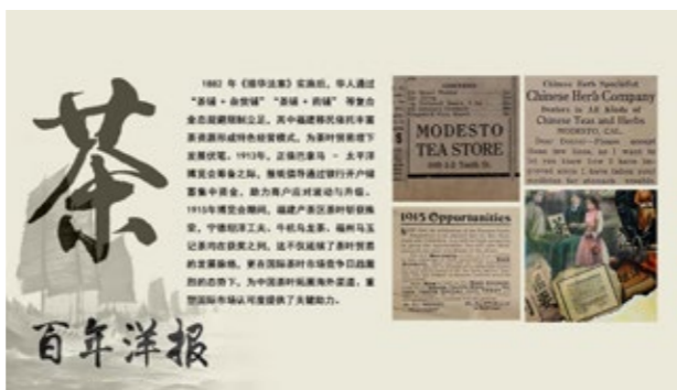
闽侨“茶铺+”复合业态模式

还有一则是1915年与巴拿马 - 太平洋博览会相关的广告残片，借博览会契机，呼吁人们把握机遇，文中还提及科约拉诺县银行（Coyote County Bank），鼓励民众到该行开户储蓄，以应对未来机遇，