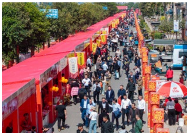
特色美食摊位前人头攒动

2025年侨家乐·福建省华侨美食文化交流活动南安专场活动聚焦“烟火气、华侨味”，探索“政府主导、市场运作”新路径，实现“聚人气、促消费、树品牌”目标。活动期间累计接待游客逾12万人次，线上直播浏览量突破5万人次，主会场销售额达205万元，带动餐饮、住宿、交通等关联消费超1700万元。