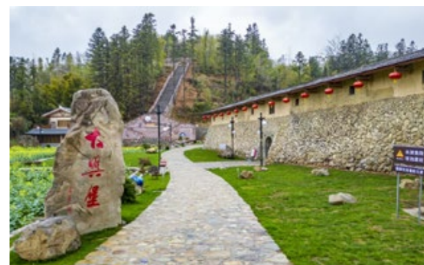
清康熙年间兴建的陶瓷出口贸易集散地——大兴堡

作为清康熙年间的陶瓷出口贸易集散地，大兴堡历经14个月的修缮，重现昔日商铺林立、瓷货流通的繁荣街景；为纪念新马侨领郑荆伦，镇里不仅设立历史记忆展示墙，更精心修缮其故居昌秀堂，让侨领的爱国爱乡精神代代相传；筹资100多万元改造霞井颜蕴章故居，将其打造成“颜化采陶瓷文化艺术馆”，用实物、图片与故事讲述华侨的奋斗历程；此外，永茂堂、锦湖堂、华侨徐冠林祖厝龙斗堂等侨厝完成改造提升，归侨徐志荣故居龙发堂修缮一新，闽台师儒郑秉才文化馆全新建成，一系列举措守住了侨文化的“根”与“魂”。