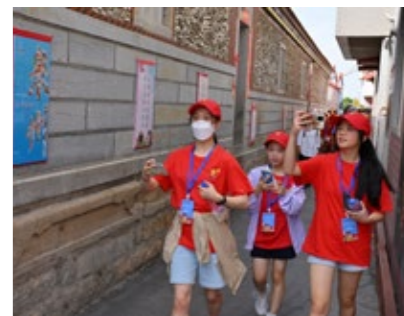
在鲟埔渔村参访研学