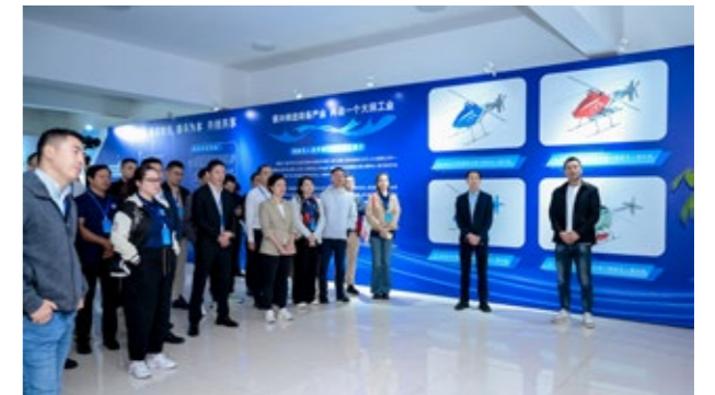
参观清航无人机公司

班精心设计了“理论 + 实践 + 交流”的立体课程体系，既能帮助大家深刻领会“嘉庚精神”的核心要义，把握新时代侨务工作的方向，又能激发事业发展、侨社建设的新思路。希望大家以本次研修班为契机，多交流、多思考、多收获，成为文化交流的纽带，把“嘉庚精神”的火种带向世界各地，为促进中外民心相通、助推中国式现代化贡献更多侨界力量！