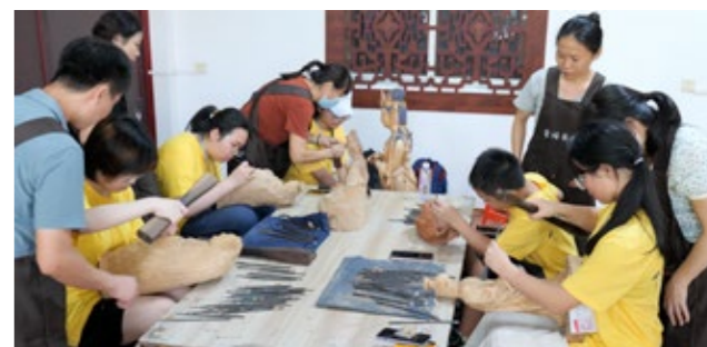
在泉福艺术馆体验木雕制作