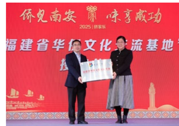
“福建省华侨文化交流基地”授牌仪式