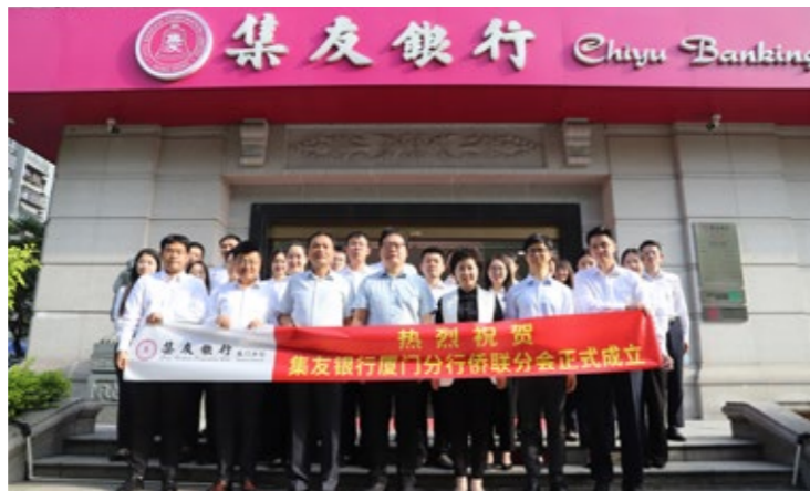
2025 年 8 月，成立福建省首家银行侨联组织——集友银行厦门分行侨联分会。

主动探索推动在“三新”组织中成立侨联组织，率先在全省侨联系统成立银行侨联组织——集友银行厦门分行侨联分会，力求在守正创新中有效实现组织“全覆盖”。同时，依托“侨胞之家”开展形式多样、喜闻乐见、“侨”味浓厚、特色鲜明的活动，进一步凝聚侨心、汇集侨力，激发活力、促进和谐。