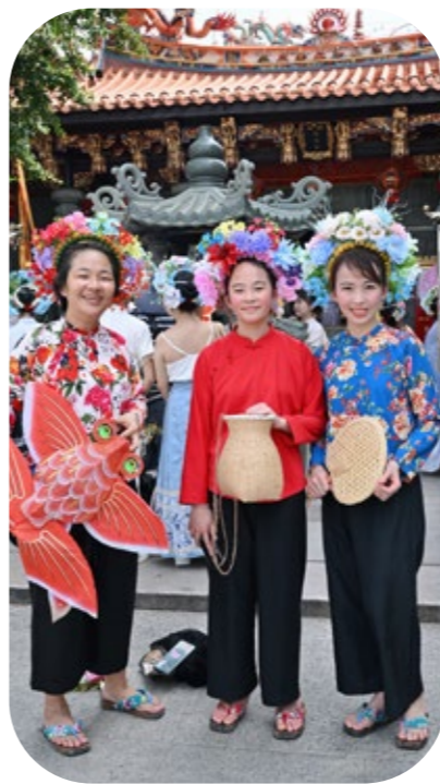
体验鲟埔簪花围造型