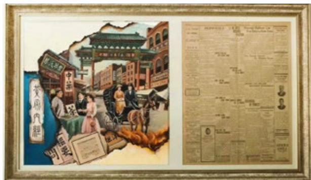
1913 百年洋报 - 锦灰堆

另一则新闻，第一则是 Modesto 茶叶店的杂货大甩卖，有陶瓷、玻璃制品、锅、桶等物件。1882