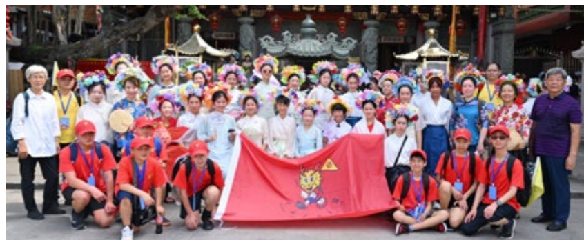
鲟埔渔村民俗体验活动结束后合影