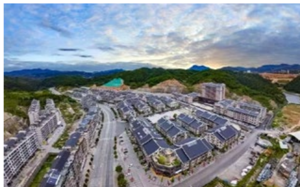
全国最大的陶瓷茶具专业市场——中国茶具城

近年来，在侨胞的“穿针引线”下，全镇成功落地招商引资项目6个，协议总投资超40亿元。其中，港资企业注资26亿元参与“印象中国白”项目，计划打造集文化演绎、文化展示、研学教育、休闲度假、居住康养于一体的陶瓷文化创意产业园，推动陶瓷文