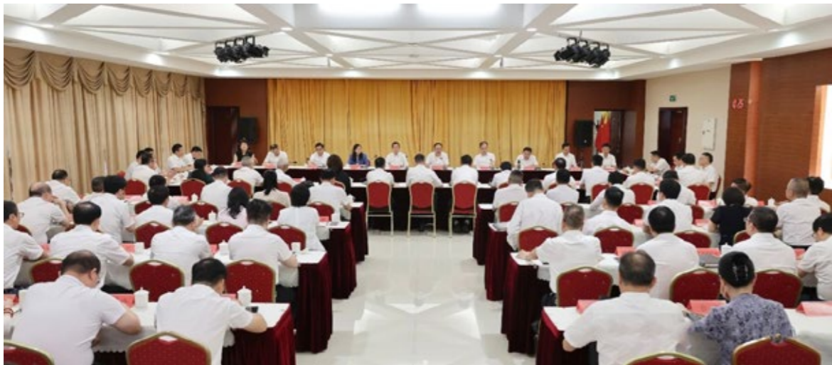
9月25日，泉州市深入贯彻落实“大侨务”观念、打好新时代新“侨牌”座谈会举行。

9月25日，泉州市深入贯彻落实“大侨务”观念、打好新时代新“侨牌”座谈会举行。泉州市委书记张毅恭出席并讲话。福建省侨联党组书记、主席陈式海出席并讲话。泉州市委副书记、市长蔡战胜主持。泉州市人大常委会主任徐华、市政协主席肖汉辉出席。本文节选自陈式海的讲话。