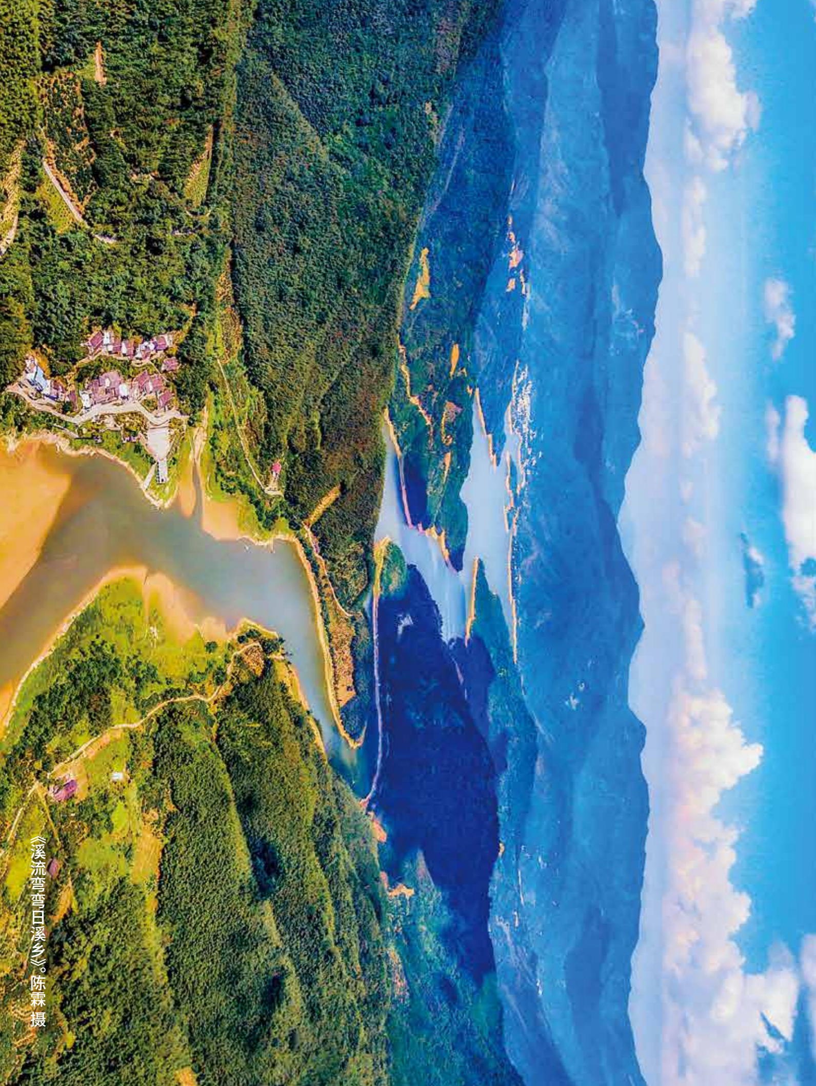
《溪流弯弯日溪乡》。