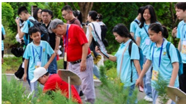
带领参加“中国寻根之旅”夏令营的华裔青少年体验中医药文化

三是充分发挥系统侨联独特作用。 卫健系统侨联主动担当作为，找准发力点，发挥独特作用。首先，在义诊服务上发力。2024年6月21日，漳州市侨联、市卫健委联合启动“健康暖侨行动”，组织各级医疗机构积极为侨胞侨眷开展义诊服务。第二，在提升侨乡医疗机构“造血功能”上发力。2024年6月22日，市卫健系统侨联组织专家团队参加“健康暖侨·漳侨情深”（常山华侨经济开发区专场）义诊服务活动，