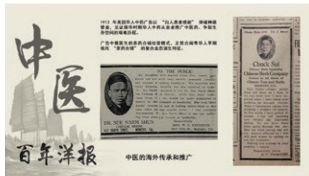
百年前中医的海外传承和推广

一则1913年美国报纸上的华人中药广告，它是当年美国排华时期华人在美艰难生存的实物见证。19世纪末至20世纪初，华人在美国主流媒体中极度边缘化，甚至被禁止刊登商业广告。这则广告里“白人患者感谢华人药铺”，恰恰是华人商家为突破种族信任壁垒的特殊手段，本质是在对抗隐性歧视，反映了当时华人中药从业者在种族歧视环境下努力推广中医药、争取生存空间的历史，能让后人直观了解那段特殊历史时期华人的经历和中医药在海外的传播情况。