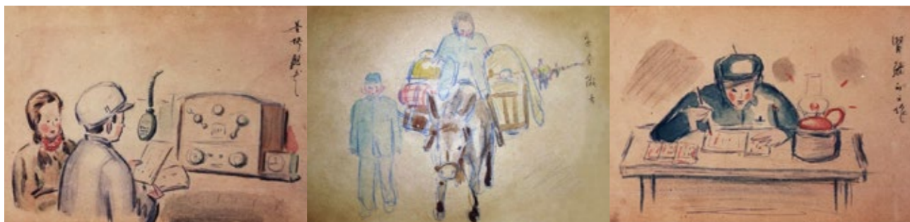
王唯真的绘画作品：《紧张的工作》