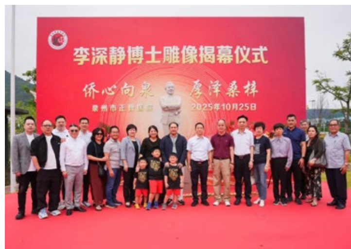
李深静博士雕像揭幕仪式全体合影