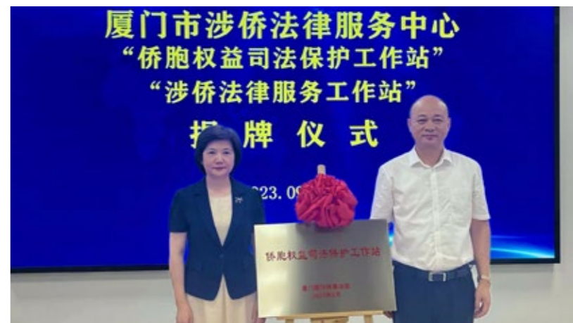
2023 年 9 月，“侨胞权益司法保护工作站”和“涉侨法律服务工作站”在联络总部揭牌。

打造品牌“暖心为侨”。依托基层侨联组织及时了解和掌握归侨侨眷家庭困难情况，市、区侨联上下联动、协作配合，挖掘、发挥侨务资源优势，打造优化一批为侨服务工作品牌，包括“温暖送百家·真情暖侨心”“侨助未来·爱心助学”“爱满重阳·情暖老侨”“心系桑梓”“近邻·暖侨”等，暖侨助侨服务覆盖侨界困难学生、重病、孤寡、高龄等群体，