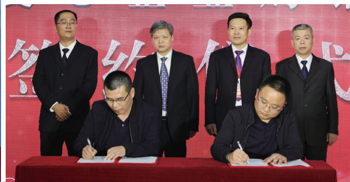
图为签约仪式现场。

努力走出一条具有闽东特色的乡村振兴之路。包括建立完善冷链物流、电商平台等服务体系,像抓精准扶贫一样抓乡村产业振兴;大力发展“互联网+农业”、农村电商等。