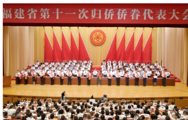
表彰省侨联系统先进工作者。