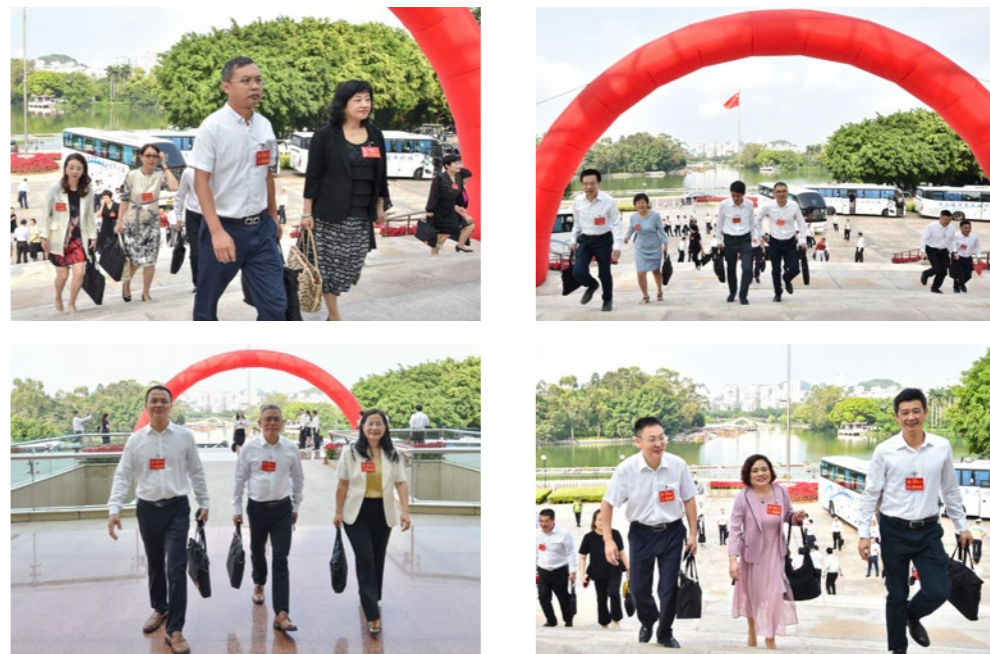
700多名侨界代表步入会场。

8时许，700多名侨界代表陆续抵达，他们肩负着福建1580万华侨华人和630万归侨侨眷的期待、期盼与重托，满怀信心步入福建会堂。