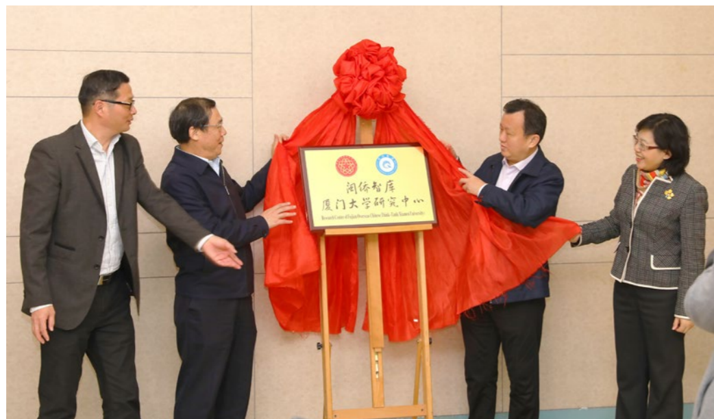
2018年12月13日，“闽侨智库”厦门大学研究中心成立。