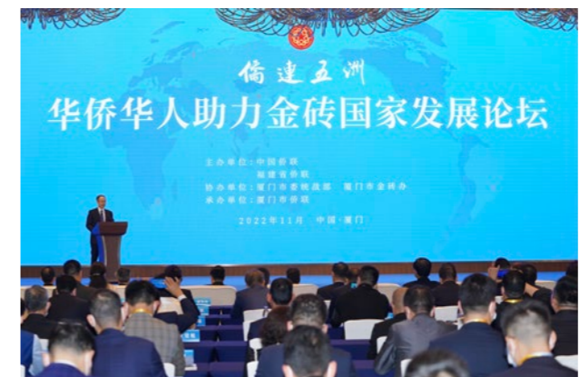
2022年11月9日，“侨连五洲·华侨华人助力金砖国家发展论坛”在厦门举办。

中国国际贸易投资洽谈会，被授予“特别贡献奖”。举办“创客中国”侨界中小企业创新创业大赛，颁授“侨界青年创新创业交流基地”“新侨人才驿站”，鼓励侨界新生代扎根鹭岛、安居乐业。多渠道参与招才引智工作，协同省侨联召开“汇聚侨界人才力量，助力创新驱动发展”主题调研座谈会，探讨新时期引智工作新形势、新挑战和新机遇。联合厦门大学开展侨界人才资源调研，探索建立常态化新侨人才工作联络机制，发挥侨智优势助力厦门市人才强市战略。举办新侨人才论坛和厦门人才环境政策解读会，组织厦门联络总部入驻侨团侨领和新侨人才代表参加“人