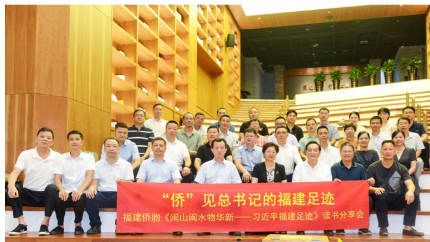
2022年7月12日，“侨”见总书记的福建足迹——福建侨胞《闽山闽水物华新——习近平福建足迹》读书分享会在福州举行。

“华侨一个最重要的特点就是爱国、爱乡、爱自己的家人。这就是中国人、中国文化、中国人的精神、中国心。中国的改革开放，中国的发展建设跟我们有这么一大批心系桑梓、心系祖国的华侨是分不开的。”习近平总书记在汕头的讲话，精辟地总结了华侨精神的实质。殷殷嘱托，振聋发聩。