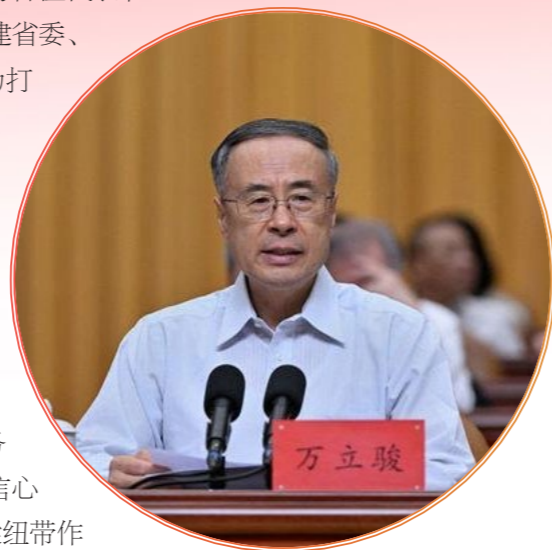
中国侨联党组书记、主席万立骏 出席开幕式并讲话。

万立骏代表中国侨联向大会召开表示祝贺，向出席大会的各位代表和全省广大归侨侨眷、海外侨胞、侨联工作者致以问候。他说，福建省委、省政府高度重视侨联工作，始终关心和支持侨联事业发展，为打好新时代“侨牌”创造了良好条件、提供了坚强保障。近年来，全省各级侨联组织深入挖掘侨乡文化内涵，深化闽台侨务交流合作，有力维护侨益，各项工作成效显著。广大归侨侨眷和海外闽籍侨胞秉承爱国爱乡、造福桑梓的优良传统，关心支持家乡建设，在传播八闽文化、加强闽港澳交流合作、促进中外友好交流等方面作出了积极贡献。希望福建省各级侨联组织和广大侨联干部高举旗帜、强化引领，坚持用习近平新时代中国特色社会主义思想凝心铸魂，坚持围绕中心、服务大局，坚持以人为本、为侨服务，用心用情做好暖侨心、树信心工作，增强侨联组织凝聚力、吸引力、影响力，切实发挥桥梁纽带作用和侨联独特优势，在谱写全面建设社会主义现代化国家福建篇章中凝聚侨界力量、彰显侨界担当、展现侨界作为。