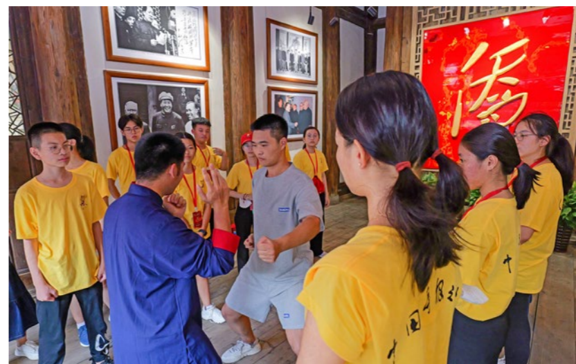
“青春同行·福建有约”——2023年海外青少年研学营。图为营员在华侨主题馆内参加自然门拳术研学。

——传播福茶文化，在32个国家和地区设立42个“福茶驿站”公益性平台，推动福建茶叶融进海外家庭、