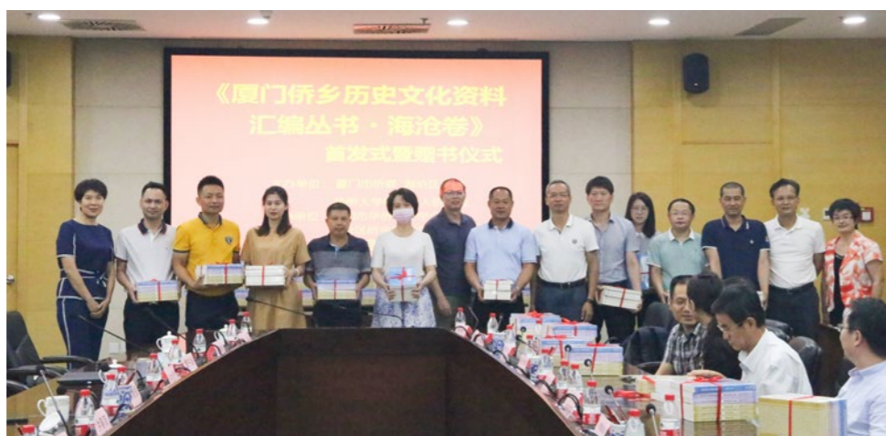
2020年8月7日，《厦门侨乡历史文化资料汇编丛书·海沧卷》首发式暨赠书仪式在海沧区举办。

掘侨乡历史文化资源，出版新阳、东孚、海沧历史文化资料选编丛书共 6 册、380 万字。指导同安区侨联推动建成竹坝归侨史迹馆，举办首届“侨家乐·福建省华侨美食风情文化节”同安竹坝专场活动；思明区侨联成立首个区级侨联侨批馆、寻根馆、侨史馆，举办多期侨批专题展，吸引了众多侨界、市民和游客参观；集美区、同安区、翔安区侨联抢救式收集整理侨村历史文化资源；思明区、同安区侨联出版《厦门侨批》《按章索局——图说厦门侨批》《同安侨批》，填补了厦门侨批研究的空白。