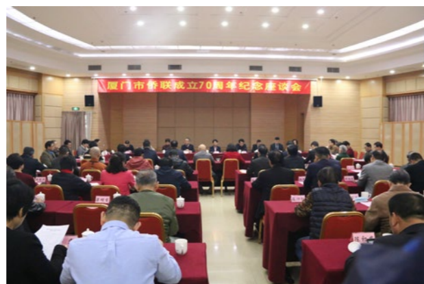
2020年12月23日，厦门市侨联成立70周年纪念座谈会召开。杨宇晴 摄

门侨界与建党百年”系列宣传，承办“习近平总书记关于侨务工作重要论述研讨会”，广泛凝聚侨界共识，画出最大同心圆。组织侨界参加“踏浪高歌·庆祝厦门经济特区建设40周年”文艺晚会演出，举办“侨心向党·弘扬嘉庚精神”侨界专场音乐会，在海外华裔青少年夏令营教学中融入“嘉庚精神”“华侨文化”主题课程，组织归侨联谊会参与中央电视台《唱支山歌给党听》录制，在央视《新闻联播》播出，引起热烈反响。通过多种渠道多样方式广泛宣传侨界精