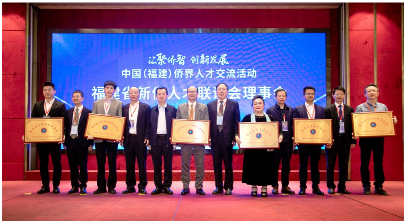
2022年11月28日,福建省新侨人才联谊会六个专业委员会授牌仪式。

福建省新侨人才联谊会成立以来,认真贯彻落实省委关于深化人才发展体制机制及全省人才工作要点,围绕服务大局和中心工作及侨胞事业发展的理念,参与推荐“中国侨界贡献奖”和“福建省新侨创新创业基地”,开展“项目对接”“侨智沙龙”“侨界专家走基层”等多种形式的活动,广泛团结凝聚侨界人才,助推福建建设和侨联事业的发展。