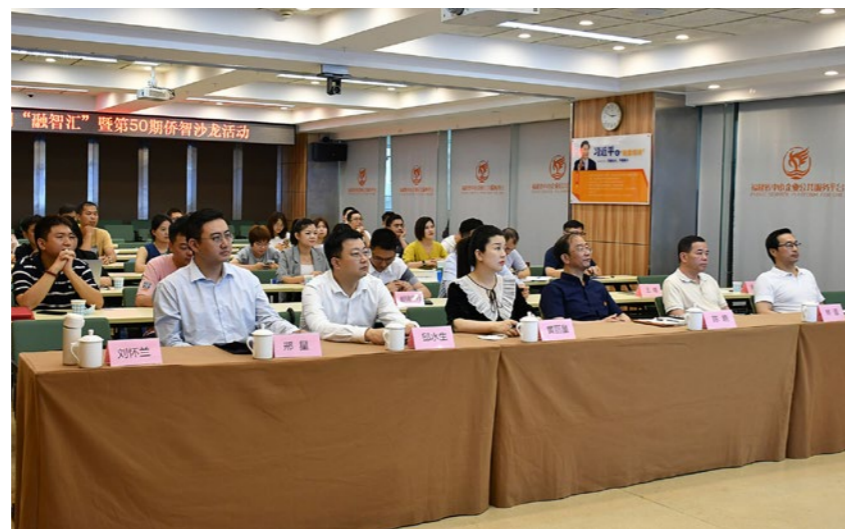
2021年5月24日，福建省侨联与福建省中小企业服务中心联合举办第十三期“融智汇”暨第50期侨智沙龙主题分享活动。

会议和论坛活动，展示推介高新技术项目近200项，与会侨界专家和高层次人才近500人次，推动了新侨人才项目成果转化。深化“侨智沙龙”品牌内涵，迄今已经举办近60场不同主题的座谈会、对接会、推介会等，累计吸