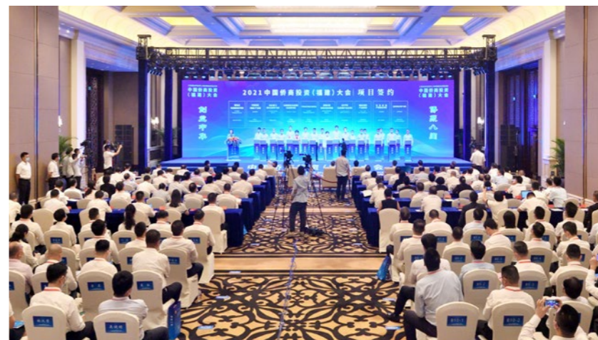
2021年9月3日，中国侨商投资（福建）大会在福州举行。

福建省委、省政府始终高度重视侨务工作，把广大侨商侨胞视为服务和融入新发展格局的一支重要力量，把“侨”作为福建的一张重要名片进行打造。与此同时，福建省侨联立足侨的资源优势，充分发挥广大侨胞资金雄厚、人才汇聚、融通中外、熟悉市场和国际规则的优势，以“创业中华”为载体，着力加大引进侨资侨智力度。