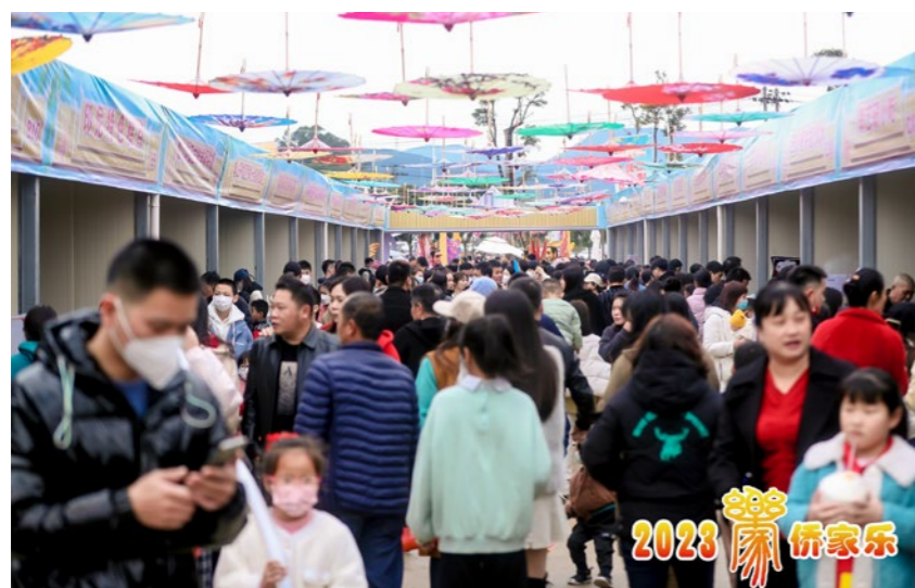
2023年2月4日下午，侨家乐·福建省华侨美食风情文化节常山华侨农场专场活动现场。

——全省侨联系统累计实施帮扶项目274项，筹集各类帮扶资金4219.31万元，惠及人数31127人；分别与福州、泉州、南平、宁德、龙岩华侨农场（村委会）建立“双联双帮”协作关系，取得了初步成效。