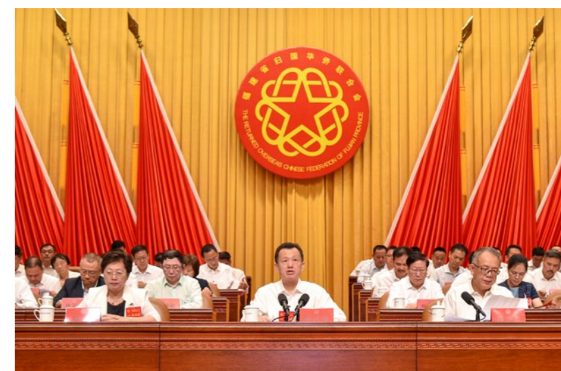
福建省侨联主席陈式海作工作报告。