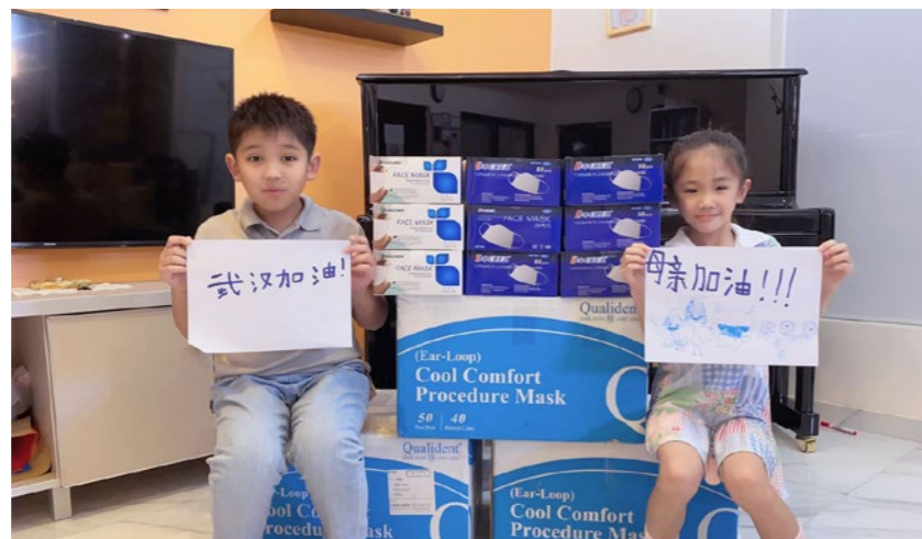
2020年疫情期间，两位福清籍阿根廷华裔儿童用春节压岁钱订购医用口罩25000只支援家乡抗疫。

同时，派出上千名精干力量，赴基层一线参加抗疫，全省共有15个侨联组织和15名同志，被中国侨联表彰为抗击新冠肺炎疫情先进集体和先进个人。