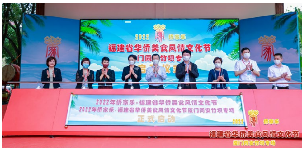
2022年4月28日，华侨美食风情文化节同安竹坝专场正式启动。