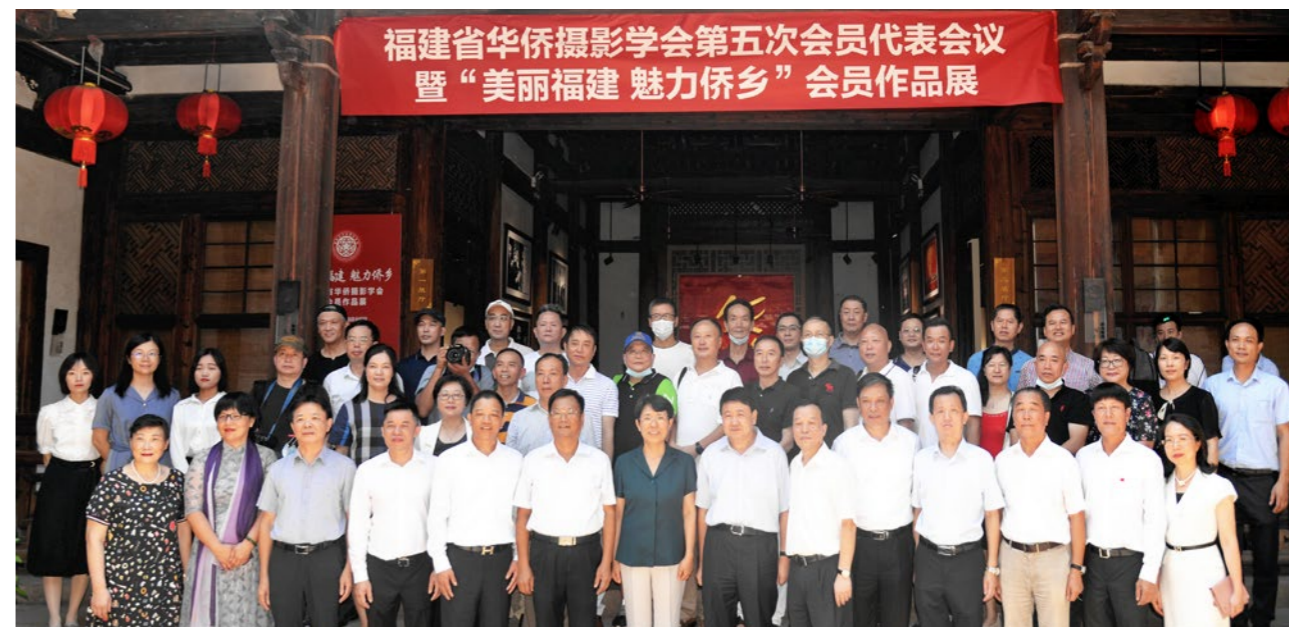
2020年8月13日，福建省华侨摄影学会第五次会员代表大会暨“美丽福建 魅力侨乡”会员作品展。

当前，学会注册会员200多名，既有侨务工作者、海外侨胞、港澳台同胞、普通归侨侨眷，也有摄影界的“大腕儿”、商界巨子、学术界的骄子等。自2020年换届以来，学会先后举办“美丽福建 魅力侨乡”会员摄影作品展、“赤子情怀——闽籍侨胞百年故事摄影展”，并在中国华侨历史博物馆、福建华侨主题馆、泉州华侨历史博物馆等地展出；组织开展“侨家乐·福建省华侨美食风情文化节系列活动”采风活动，完成“庆祝二十大 侨心永向党”摄影展并出版画册，为宣传侨乡福建新面貌作出积极贡献。