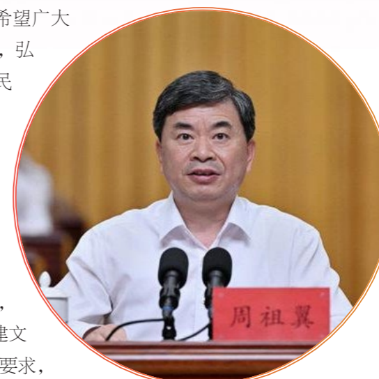
省委书记、省人大常委会主任周祖翼出席开幕式并讲话。

周祖翼说，党的十八大以来，以习近平同志为核心的党中央高度重视做好侨务工作，习近平总书记作出一系列重要论述，为我们做好新时代侨务工作指明了前进方向。福建是全国重点侨乡，广大归侨侨眷和海外侨胞与家乡有着割舍不断的血脉情缘，八闽大地永远是大家身心停泊的“港湾”。他希望广大归侨侨眷和海外侨胞始终高举爱国旗帜，胸怀民族复兴大业，弘扬以陈嘉庚为代表的华侨精神，积极响应党的号召，做中华民族伟大复兴的同心圆梦者。始终心系家乡发展，充分发挥自身优势，积极投身新福建建设，献计出力、穿针引线、添砖加瓦、铺路搭桥，延续善心义举，积极回馈桑梓，做推进福建高质量发展的积极参与者。始终促进闽台融合，积极搭建更多有利于深化两岸交流合作的平台，推动闽台产业深度融合，让两岸同胞越走越近、越走越亲，做祖国统一大业的坚定拥护者。始终坚定文化自信，增强文化认同、筑牢文化根基，推动文明交流互鉴、增进民心交融互通，促进中华文化、福建文化更好走向世界，做中华优秀传统文化的有力传播者。周祖翼要求，全省各级党委政府要加强侨联工作的领导，依法维护侨界合法权益，为做好侨联工作提供有力保障。全省各级侨联组织和广大侨联干部，要更好地凝聚侨心、汇聚侨智、维护侨益、发挥侨力，当好归侨侨眷和海外侨胞的贴心人，以实际行动坚定拥护“两个确立”、坚决做到“两个维护”。