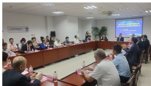
2022年9月8日，市侨联举办厦门联络总部第七批海外社团入驻仪式暨投资项目推介会。

征文、“学缘、侨缘、厦门缘，缘来一家亲”在厦华裔留学生庆新春、海外华裔青少年特色夏令营、“中国寻根之旅”夏令营、“亲情中华·为你讲故事”网上夏令营等主题活动；联合翔安区侨联举办两届“侨