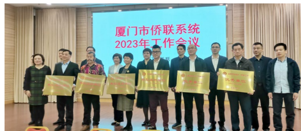
2023年3月10日，为荣获全国侨联系统优秀“侨胞之家”和典型选树单位授牌。