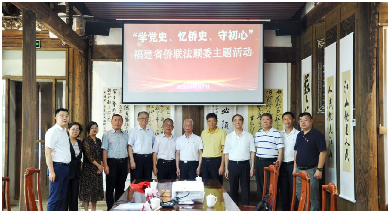
2021年7月7日，福建省侨联法顾委开展“学党史、忆侨史、守初心”主题活动。

福建省侨联法顾委坚持“以人为本、为侨服务”宗旨，依法维护广大海外侨胞和归侨侨眷在国内的合法权益。其主要工作职责：参与有关侨务政策、法律和法规的修订、咨询、研讨；向归侨侨眷和海外侨胞进行法律宣传，提供法律咨询服务；为海外侨胞和归侨侨眷在国内的合法权益提供法律咨询服务，帮助协调解决涉侨疑难案件；对海外侨胞和归侨侨眷在国内合法权益受到侵害时提出的诉讼或非诉讼法律请求，依法提供法律支持和帮助；接受委托对涉侨案件进行研讨，提供法律意见；配合福建省侨联开展有关海外侨胞和归侨侨眷在国内合法权益状况的调研，提供依法维护侨益工作意见；指导设区市和县（市、区）侨联法顾委、法律咨询机构开展工作；承办省侨联交办的其他法律事务。