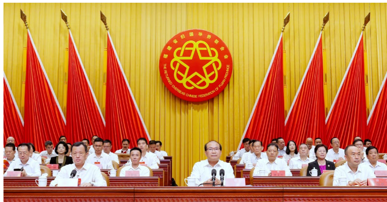
省委常委、统战部部长王永礼出席闭幕式并讲话。

8月18日上午，福建省第十一次归侨侨眷代表大会闭幕式在福州举行。省委常委、统战部部长王永礼出席并讲话，省政协副主席黄如欣出席闭幕式。