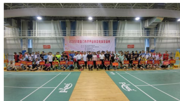
2022年10月29日，市侨联在市体育中心举行厦门市侨界业余羽毛球友谊赛。

门对外联络交流的一座桥梁、一张名片，获得上级有关领导的关注和肯定，多位省部级领导莅临指导。积极探索互动模式。厦门市侨联推行“基层侨联（涉侨社团组织）+海外华侨华人社团”合作模式，与境外52个国家和地区的150多个重点侨社建立常态化联系，巩固“以侨为桥、以侨联侨，以内联外、内外联动”工作格局。承办“两岸侨联和平发展论坛·海峡两岸暨港澳侨界圆桌峰会”；组团出访东南亚、南美等国家，走访港澳台侨团，积极拓展海外联络联谊渠道；参与推动世界同安联谊会成为厦门海外乡亲联谊交流一大平台。积极强化共情共鸣。举办“亲情中华——欢聚吉隆坡”海外慰侨演出、侨界联欢节、侨界健步行、“侨界最美家庭”评选系列活动；助力华侨华人题材歌仔戏《侨批》获评第十六届精神文明建设“五个一工程”奖；组织开展《侨与新中国共成长》