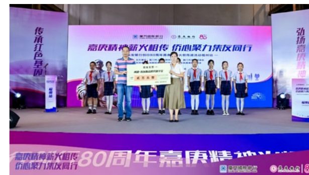
集友银行福州分行向福州市华侨小学学生捐赠“闽都—集友陈嘉庚奖助学金”。

未来，集友银行福州分行将继续高擎华侨金融旗帜，充分发扬侨资银行的优势，发挥服务“侨”梁作用，助力凝聚侨资侨智侨力，为进一步推进华侨金融高质量发展、谱写福建发展新篇章贡献更大的集友力量。