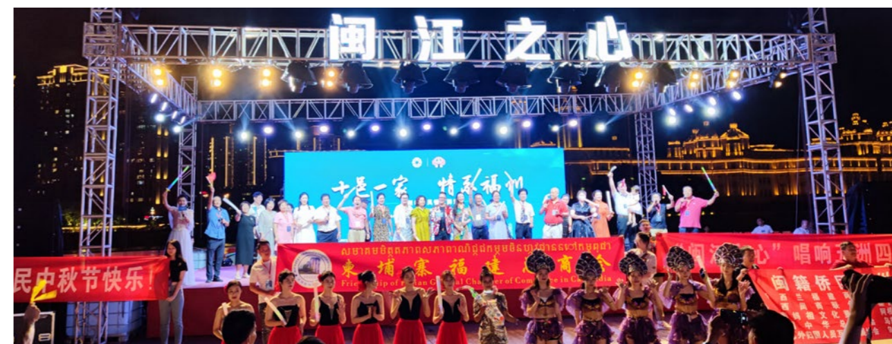
“闽江之心”活动现场，侨胞合唱歌曲《世界福州一家亲》。

发动侨界参与脱贫攻坚、乡村振兴。自2017年以来，共筹集社会资金304.4万元，帮扶贫困群众1000余人次，累计向甘肃省定西市捐赠100余万元，持续跟踪闽宁协作，动员侨商侨企对口帮扶宁夏固原市，向宁夏固原市捐款28万元。承接中国侨联“侨爱心·光明行”公益项目，帮助1000多名困难白内障群众复明。