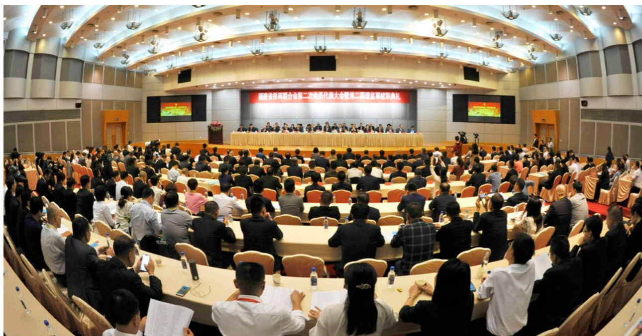
2019年11月11日，福建省侨商联合会第二次会员代表大会暨第二届理监事就职典礼现场。

福建省侨商联合会目前设有官方网站、微信公众号等，为会员提供信息服务和咨询服务。 福建省侨商联合会的最高权利机构是会员大会，每年召开一次常务理事会议或理事会。