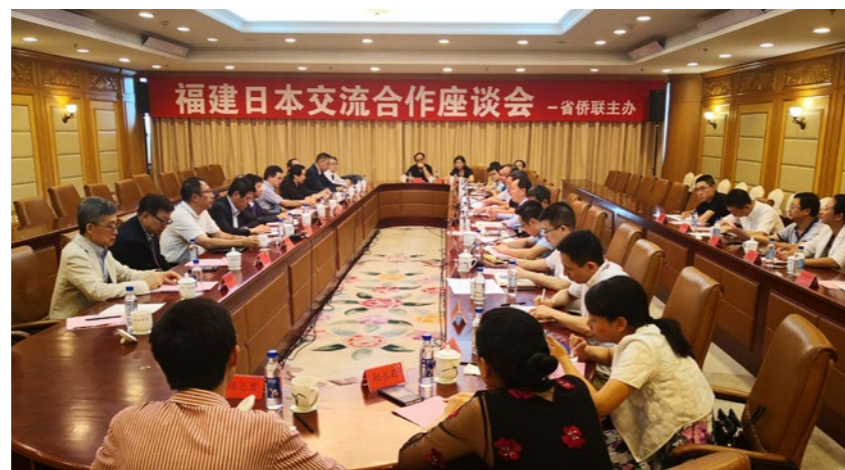
2019年9月11日，应福建省侨联邀请来闽访问交流的日本华人教授会专家一行与福建省直有关部门召开“福建日本交流合作座谈会”。

文化促进会等主办的“5·18”日本馆活动，30多位中日企业家参展，达成16项合作意向；2019年9月，与省农业农村厅联合举办2019“厦洽会”现代农业（食用菌）项目投资洽谈会，吸引了侨商代表就扩大海外市场达成共识，并与中国供销集团、省供销社共同主办首届“一带一路”农产品农资（电商）交易会和投资合作高峰论坛，15个团组120多名侨商代表参加大会活动，多个项目签约成功。