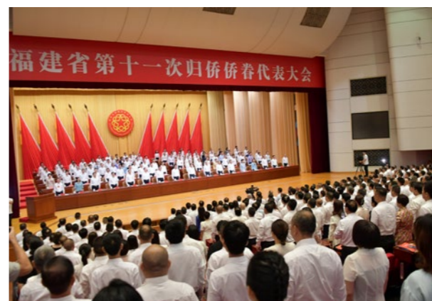
大会现场。