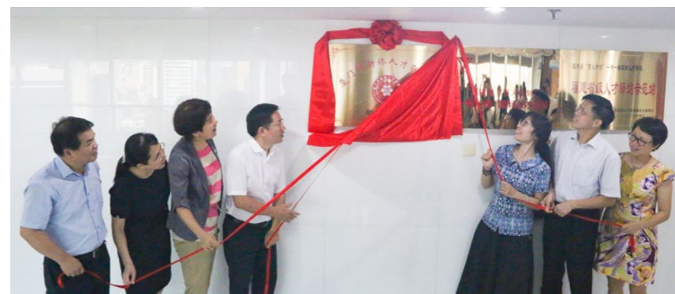
2020年7月22日，厦门市侨联首家“新侨驿站”在市对外服务中心揭牌。

新时代，新征程，新担当，新作为。厦门市各级侨联组织坚守初心谋发展，久久为功立潮头，真抓实干争朝夕，在推动侨联事业高质量发展过程中，不断发现新规律、探索新做法、闯出新路子、开创新局面。