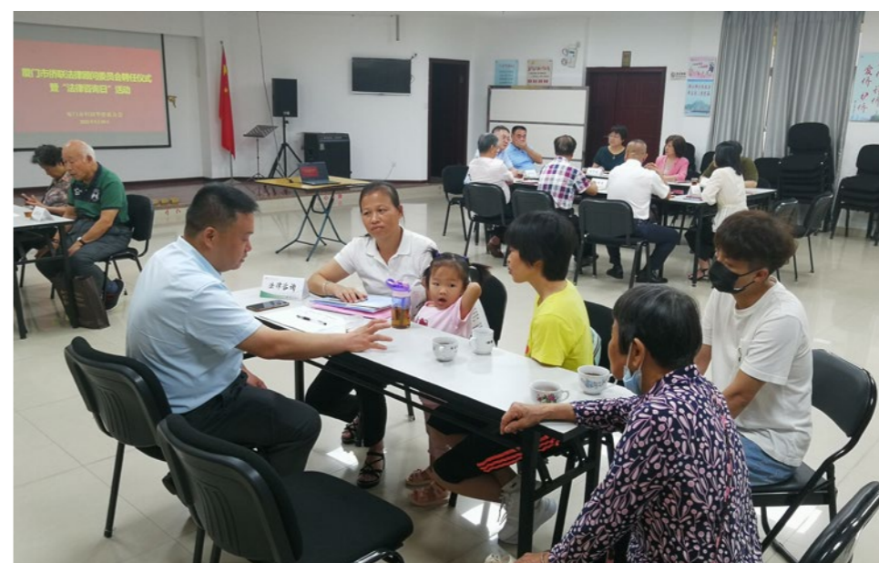
2021年5月30日，市侨联法律顾问委员会在“侨胞之家”为归侨侨眷免费提供法律咨询服务。

侨商助学等专项帮扶，全市侨联系统共慰问帮扶困难侨超过10000人次，发放慰问帮扶金超1000万元。发动党员干部参与“爱心厦门”建设工作，主动帮扶困难对象100多人次。成立“联心侨”侨界志愿者联盟，着力打造服务品牌，入围市直机关优秀党建品牌评选；联合华侨大学开展“归根情·老侨说”系列活动，“归根献深情，侨青志愿行”项目获评“全国大学生志愿服务社区示范项目”，并入选“全国青年志愿服务优秀项目库”。