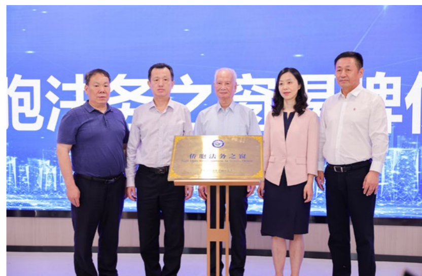
2023年6月12日，“侨胞法务之窗”在海丝中央法务区福州片区服务中心揭牌成立。

——2022年全国两会期间，福建代表团以全团名义提交了关于支持福建建设闽籍华侨华人“寻根”工程的建议，该建议从两会现场发出，通达五湖四海、世界各地。