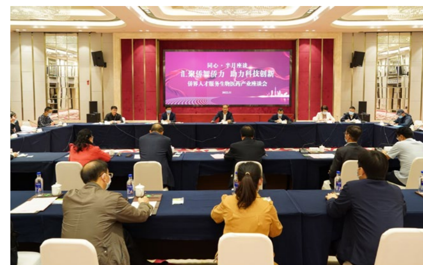
2022年11月27日—29日，由福建省侨联与省新侨人才联谊会共同主办的中国（福建）侨界人才交流活动在福州举行。

难点问题；2022年福建省新侨人才联谊会建立侨专数据库，设立6个专业委员会，遴选了千名侨界各行业科技和社会人才；参与中国侨联和福建省委人才办部署