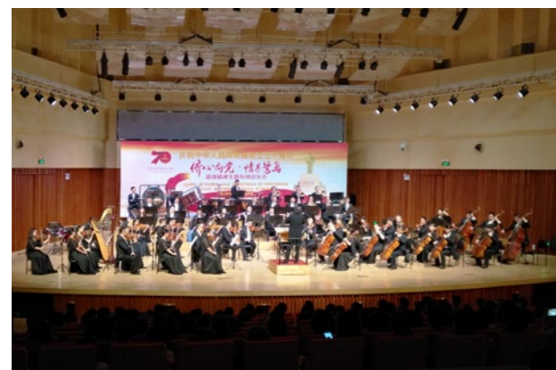
2019年11月8日，“侨心向党·情系鹭岛”侨界专场音乐会。

革开放40周年·侨与厦门的故事》《厦门市侨联简史》，推出“侨建厦门40年”纪实宣传片、“侨与特区共奋进”图片展、“厦门经济特区建设四十年四十事”“中国梦·桑梓情——侨与厦门的故事”“厦