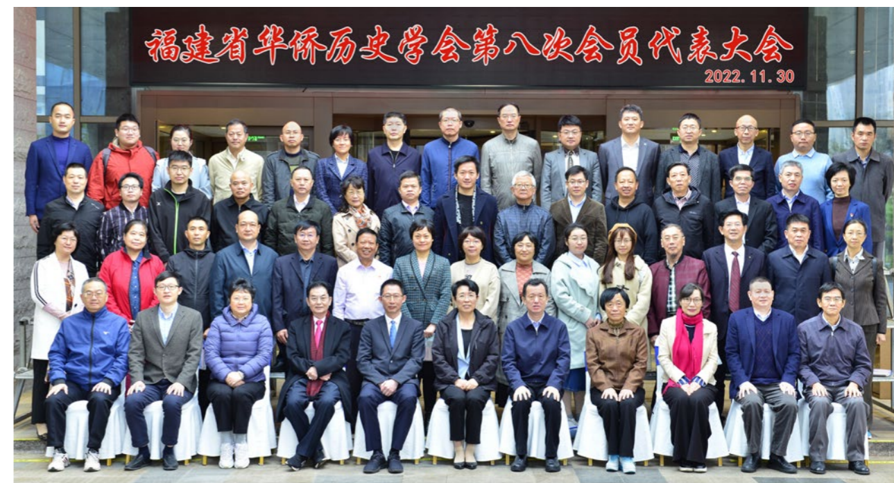
2022年11月30日，福建省华侨历史学会召开第八次会员代表大会。

1990年代，在福建省侨联指导下，由学会编写的三本书籍《华侨历史论丛》《改革开放与福建华侨华人》《浓浓赤子情》，时任福建省委副书记习近平同志为三本书作序，留下宝贵财富。近年来，各地学会和高校科研院所等相关机构，从自身优势和定位出发，开展各具特色的学科建设、学术研究和学术交流活动。参与编辑出版了《中国华侨农场史》（福建卷）《共和国侨胞（福建卷）》《邮票上的华侨华人》等大型著作。指导部分设区市侨史学会开展研究。如，龙岩侨史学会编撰出版了《龙岩华侨史》《闽西华侨与中国革命》等11部书籍和学术论文；泉州侨史学会编撰《泉州历史文化概览》，出版《十九世纪以来晋江侨乡与马尼拉之间的经济文化整合研究——以晋江侨批为中心》等书籍；福州侨史学会联合闽侯县侨联、荆溪镇港头村编撰了《港头侨史》一书；三明侨史学会编辑出版《天涯海角三明人》等文献；漳州侨史学会编辑了《华侨女英雄李林》画册；南安侨史学会编撰完成了《南安华侨志》《黄仲咸故事》等9部侨史资料。