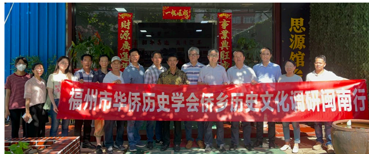
福州市华侨历史学会侨乡历史文化调研闽南行。

发动侨界参政建言，承办重点调研课题，五年多来全市各级侨界代表委员提出议案、建议800余件，提案1000余件。