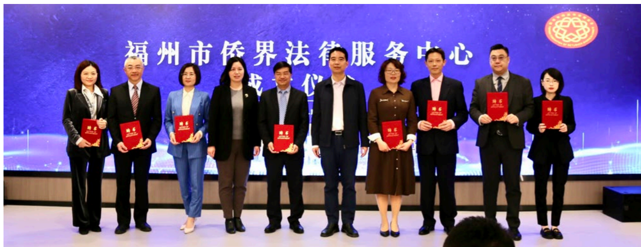
8位律师受聘为首批福州市侨界法律服务中心成员。

求多元化的趋势，市侨联着力构建涉侨纠纷多元化解新格局，建立“多元化”维权机制，与法院、司法局、公安边防、仲裁委、公证处、律师事务所、海外社团及华人律师所等合作，打造涉侨纠纷的诉讼调解。联合中院针对新时期涉侨纠纷的司法特点，出台涉侨案件诉调对接机制，18名市侨联法顾委成员受聘