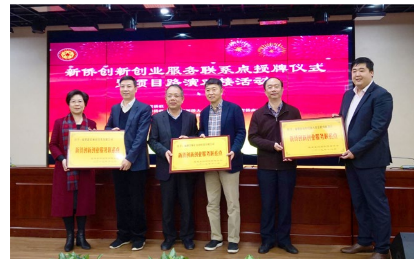
2019年12月18日，福建省侨联“新侨创新创业服务联系点”授牌仪式暨项目路演对接活动在福州软件园举行。

引5000余人次参加线上线下的交流互动，构筑了侨资侨智协同创新机制。探索设立“新侨创新创业服务联系点”，以侨资侨智集中、创新创业成效突出、新侨人才聚集效应明显作为评定标准，至今累计设立了包括科研机构、创业园区、侨资企业在内的24家联系点单位，服务新侨创新创业。为更好地发挥引领示范作用，2022年起，3家代表性侨资企业升级为第一批“福建省侨联新侨创新创业基地”，进一步凸显平台效应，引才聚才。