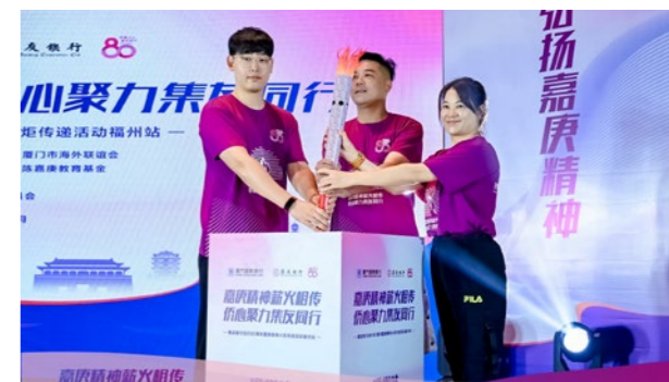
三位火炬手共同将火炬放回放置台。