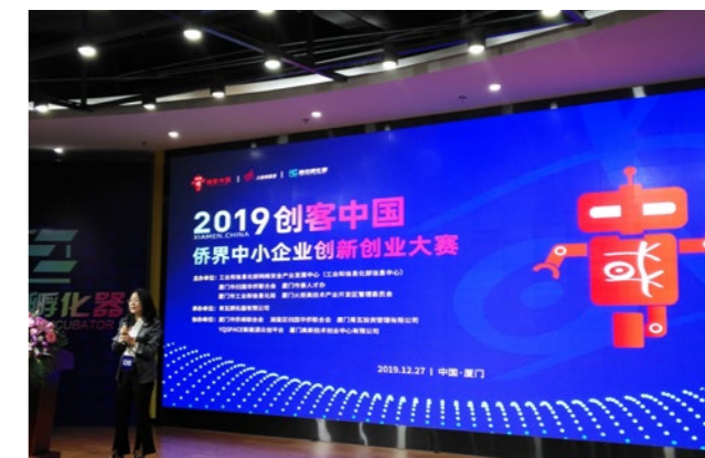
2019年12月27日，“创客中国”侨界中小企业创新创业大赛。